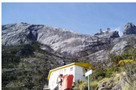
↑宿泊する山小屋は概ね快適です