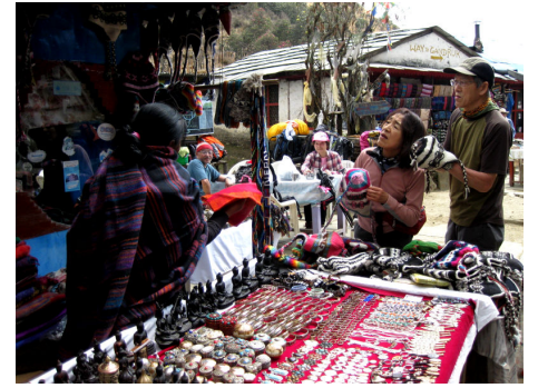
露店での品定めも楽しい