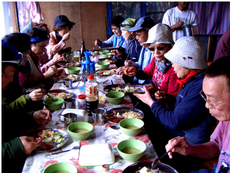
食事風景(デオラリ)