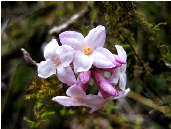
沈丁花(じんちょうげ)も開花