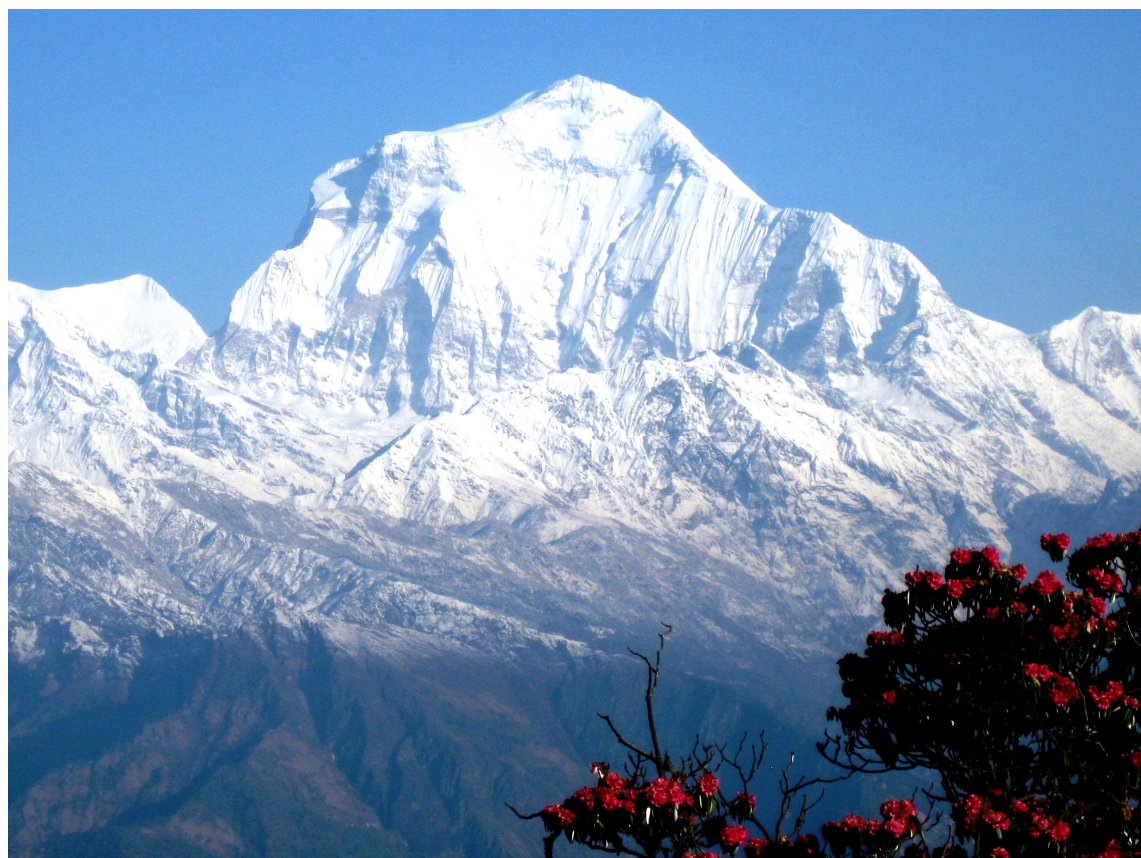
しゃくなげとダウラギリI峰