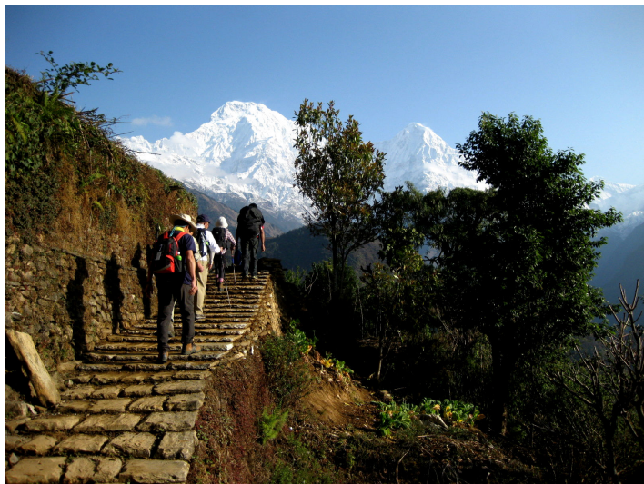
アンナプルナ南峰(7,219m)を見ながら石段の街道を行く