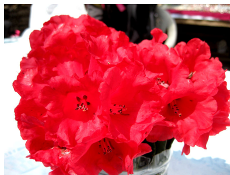
鮮やかなラリガラスの花