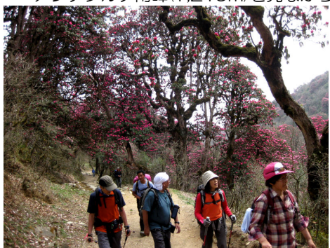
しゃくなげの森を歩く