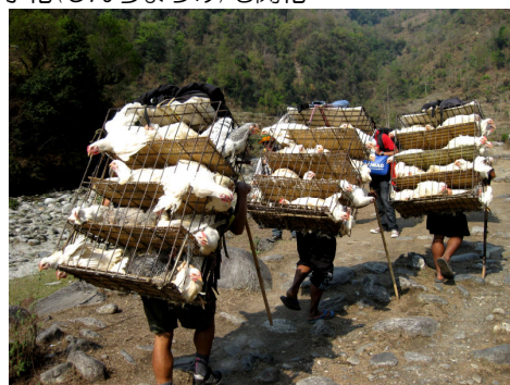
生きたニワトリを運ぶポーター