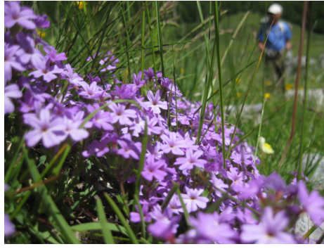
ゲラニウム(フクロソウ)