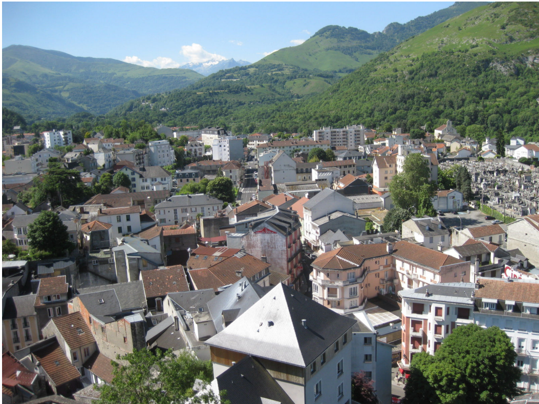
城塞から俯瞰するルルドの町並み

今日は、ここ聖地ルルドで観光&自由行動。聖域」の観光。ロザリオ聖堂～その上の教会～奇跡の泉～ローソクスタンド～バジリカ地下聖堂…。グロット通りを通過して城塞へ。“サクレクール”という大聖堂。