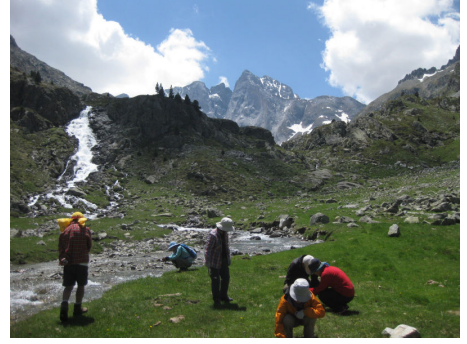
ビニイマーレ峰北壁を望むアルプ