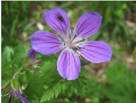
ピオラカルカラタ(スマレ)