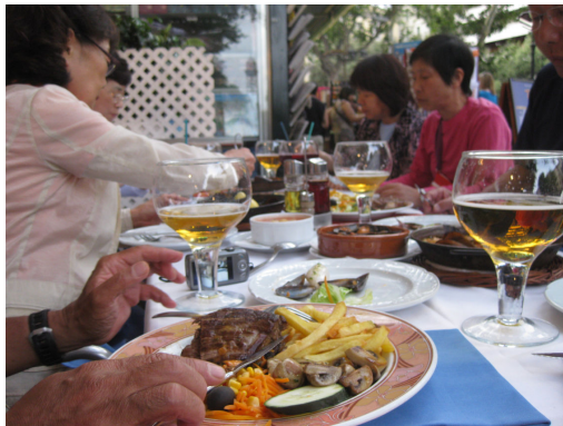
タパスやステーキ