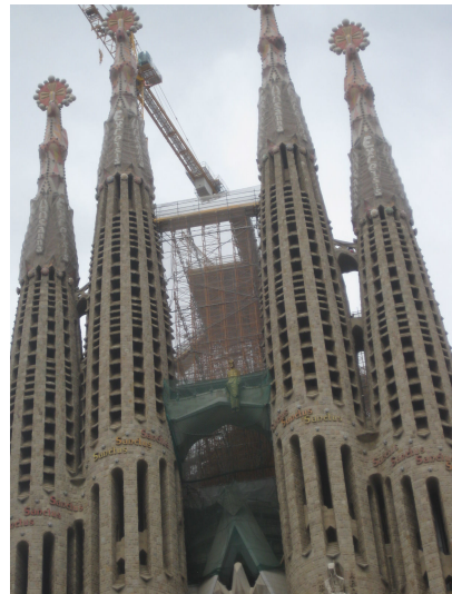
バルセロナと言えばガウディ建築