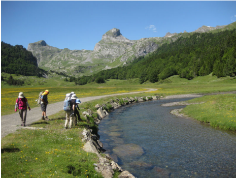
ピオウ川に広がるメドウ