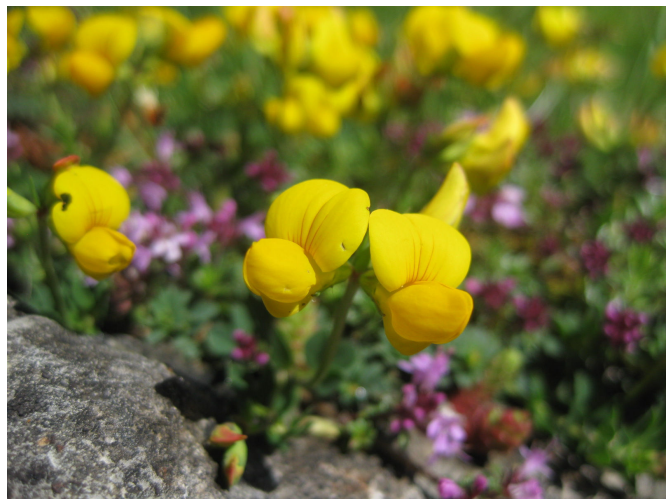
周辺は高山植物の宝庫