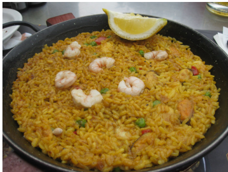
パエリア・デ・マリスコス