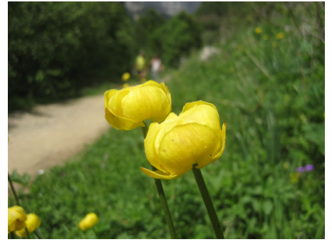
トロリウス(キンポウゲ)