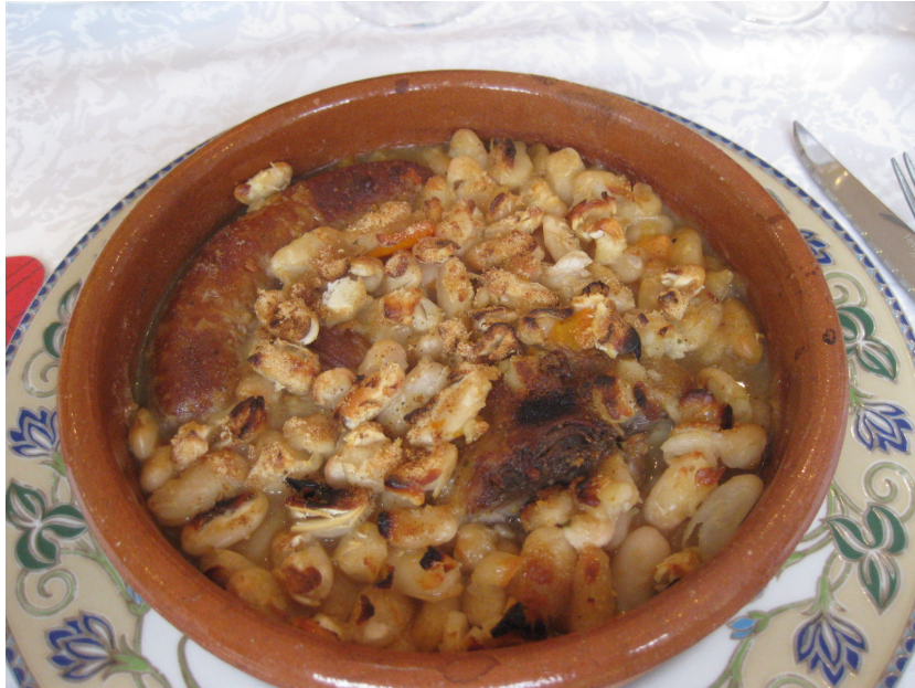
この地方名物の豆料理“カスレ”。タルブ産の大豆を使ったとても美味しい料理だ。

カトリックの聖地ルルドのほど近い Ade のレストランで昼食後、一路ガバルニーへ。