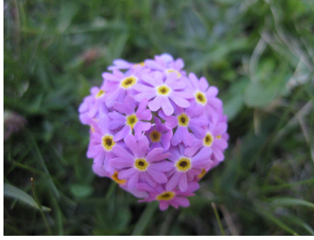
球状に丸く咲いたプリムラ(サクラソウ)