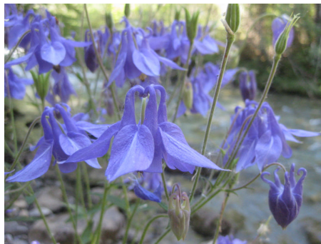
コロンバイン(オダマキ)