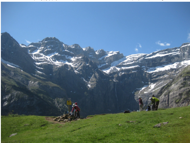
ガバルニーの大岩壁を望む