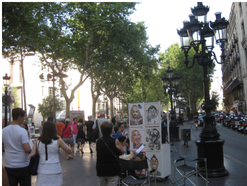
賑やかなランブラス通り(バルセロナ)

タパス各種、パエリア数種、ステーキなど10品目ほどオーダーし、巨大なセルベッサやサングリアで乾杯！