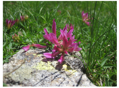
トリフォリウム(シャジクソウ)