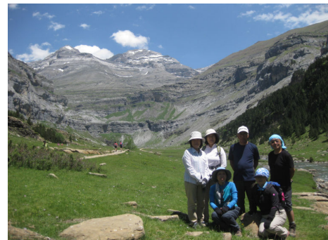
溪谷最奥部 Puente de Soaso