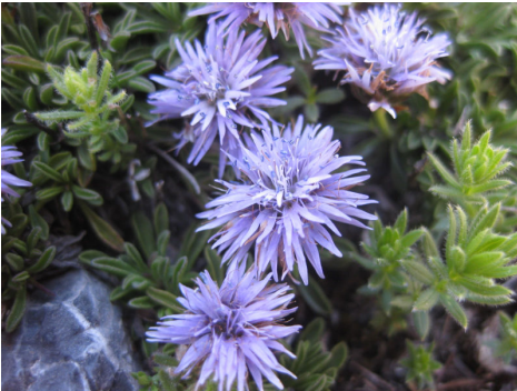
グロブラリア(ルリカンザシ)