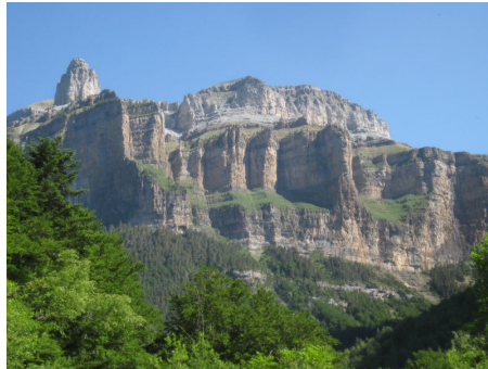
オルデサの大岩壁