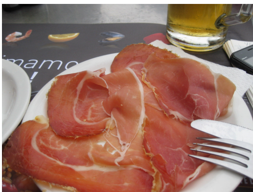
ハモン・イベリコ(イベリコ豚の生ハム)