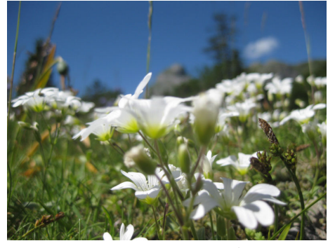
ケラステウム(ミミナグサ)