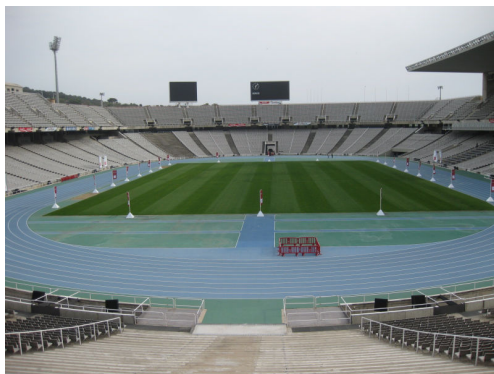
オリンピックスタジアム