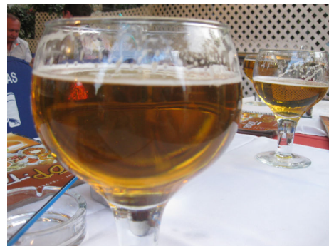
セルベッサ(ビール)