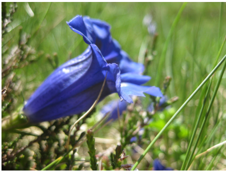
ゲンチアナ(リンドウ)