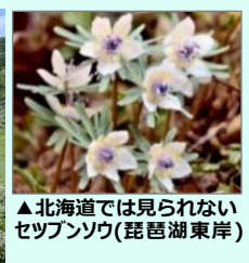
▲北海道では見られないセツブンソウ(琵琶湖東岸)