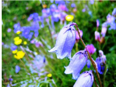
カムバヌラ・バルバタ (ホタルブクロ)