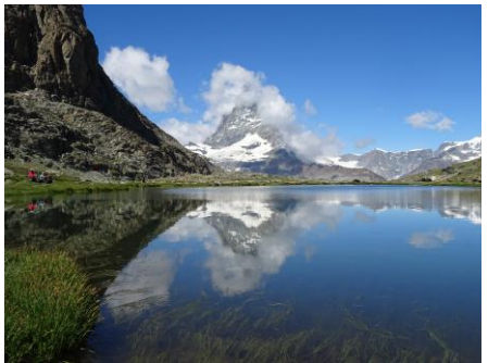
逆さまッターホルンを映すリッフェルゼー

スイス南部ヴァレー州はワインの名産地。イタリアと国境を接するマッターホルンのお膝元、ツェルマットの村が中心。きれいな空気を保つため自動車の乗入れは禁止されています。ゴルナーグラードでは眼下に長大なゴルナー氷河、盟主マッターホルンをはじめ、モンテローザ、リスカム、ワイスホルン、ロートホルン、ドムなどの大パノラマが広がります。トレイルは高山植物の宝庫です。