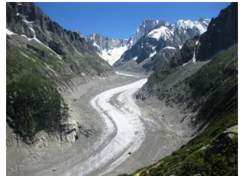
メールドグラス氷河とグランドジョラス

国境を越えてフランスへ。アルプス最高峰モンブラン山麓、シャモニーモンブランの街がベースです。ミディ針峰、ドリユ針峰、シャモニ針峰、ルージュ針峰、そしてメールドグラス氷河の奥に幾多の山岳ドラマを生んだグランドジョラス北壁などを見ながら、高山植物の多い快適なハイキングトレイルを楽しめます。国際色豊かな山岳リゾートでの観光やショッピングも楽しみです。