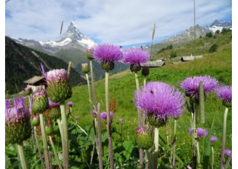
キルシウムの群落とマッターホルン

スイス南部ヴァレー州はワインの名産地。イタリアと国境を接するマッターホルンのお膝元、ツェルマットの村が中心。きれいな空気を保つため自動車の乗入れは禁止されています。ゴルナーグラードでは眼下に長大なゴルナー氷河、盟主マッターホルンをはじめ、モンテローザ、リスカム、ワイスホルン、ロートホルン、ドムなどの大パノラマが広がります。トレイルは高山植物の宝庫です。