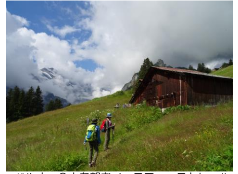
ベルナー三山を望むノースフェーストレイル

中央スイスのブリエンツ湖とトゥーン湖に挟まれた街インターラーケンが入口です。“ベルン州の高地”という意味のベルナーオーバーラントにあるアイガー、メンヒ、ユングフラウは「ベルナーオーバーラント三山」と呼ばれ、深く切れ込むU字谷や、アイガーの岩壁をくり抜いて作られたユングフラウヨッホ鉄道など多くの魅力的なスポットに溢れています。トレイルは高山植物の宝庫です。