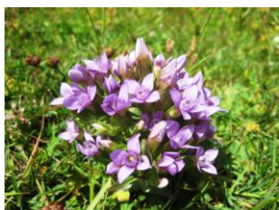
ゲンティアネラ・アモサ (チシマリンドウ)