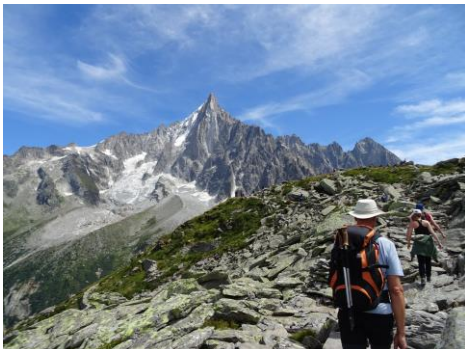
ドリユ針峰を望むトレイル

国境を越えてフランスへ。アルプス最高峰モンブラン山麓、シャモニーモンブランの街がベースです。ミディ針峰、ドリユ針峰、シャモニ針峰、ルージュ針峰、そしてメールドグラス氷河の奥に幾多の山岳ドラマを生んだグランドジョラス北壁などを見ながら、高山植物の多い快適なハイキングトレイルを楽しめます。国際色豊かな山岳リゾートでの観光やショッピングも楽しみです。