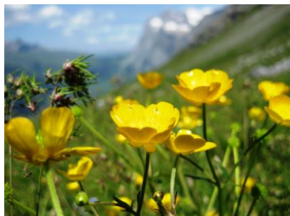
ラヌンクルス・フリエシアヌス (キンポウゲ)