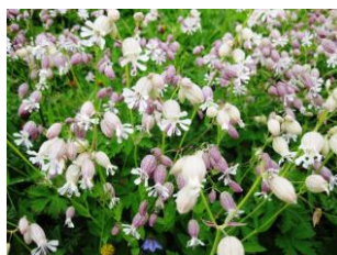
シレネ・ウルガリス (マンテマ)