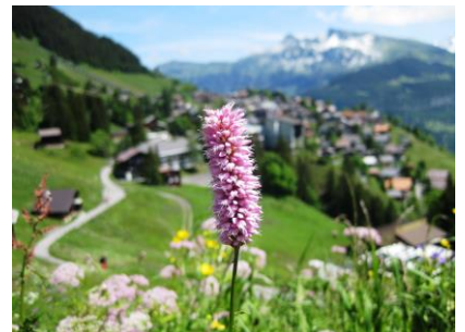
ビストルタ・ウルガリス (イブキトラノオ)