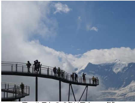
フィリストの“クリフウォーク”

中央スイスのブリエンツ湖とトゥーン湖に挟まれた街インターラーケンが入口です。“ベルン州の高地”という意味のベルナーオーバーラントにあるアイガー、メンヒ、ユングフラウは「ベルナーオーバーラント三山」と呼ばれ、深く切れ込むU字谷や、アイガーの岩壁をくり抜いて作られたユングフラウヨッホ鉄道など多くの魅力的なスポットに溢れています。トレイルは高山植物の宝庫です。