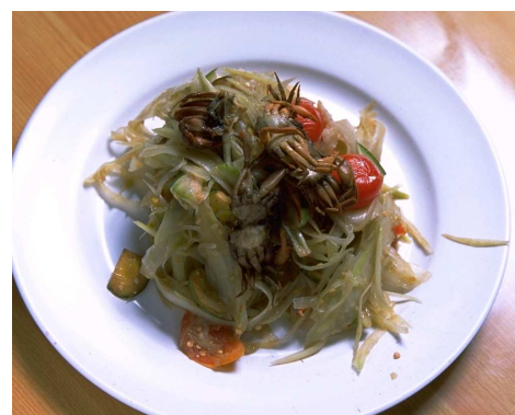
パパイアのサラダ「タムマークファン」