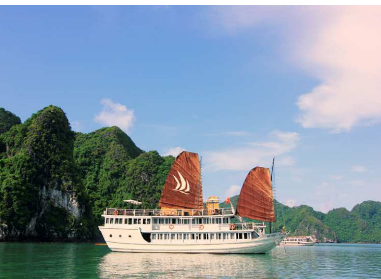
ハロン湾の絶景を眺めながら、のんびりクルーズ。贅沢なひとときです(イメージ)

標高 1600m に位置するベトナム屈指の避暑地。カラフルな衣装を纏った少数民族が行き交い、のどかな雰囲気漂います。郊外には「世界で美しい棚田 7 選」に選ばれた棚田が広がり、晴れた日には、ベトナム最高峰ファンシーパンの神々しい山容をのぞむことができます。