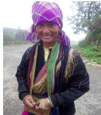
サバ近郊の黒モン族の女性

ラオカイ～ハノイ間は約 300km。ラオカイを 21 時頃に出発し、ゆっくり走って翌朝 6 時頃にハノイに到着。約 9 時間の乗車です。客室は 2 列 2 段ベッドの 4 名コンパートメント。清潔な寝具が備えられていて快適に過ごせます。