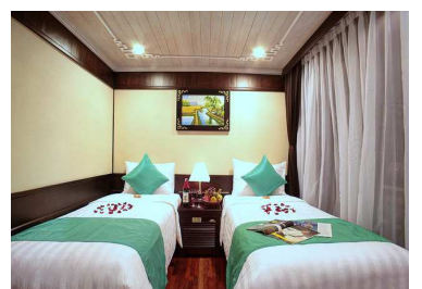
船内の客室は清潔で設備も充実しています(イメージ)