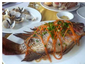
地元の海の幸が並ぶ船内の食事もお楽しみです(イメージ)

ハロン湾 ハノイから 180km、「海の桂林」と称されるベトナム随一の景勝地。数千の島々と奇岩がエメラルド色の海面から突き出す光景は神秘的で、その絶景を眺めながらクルーズ船で味わう海鮮料理も人気です。通常は 3 時間ほどの日帰り遊覧観光のところ、当ツアーでは快適なクルーズ船に泊まり、沖合の島々まで絶景をたっぷり観賞。船内の多彩なアクティビティもお楽しみいただけます。