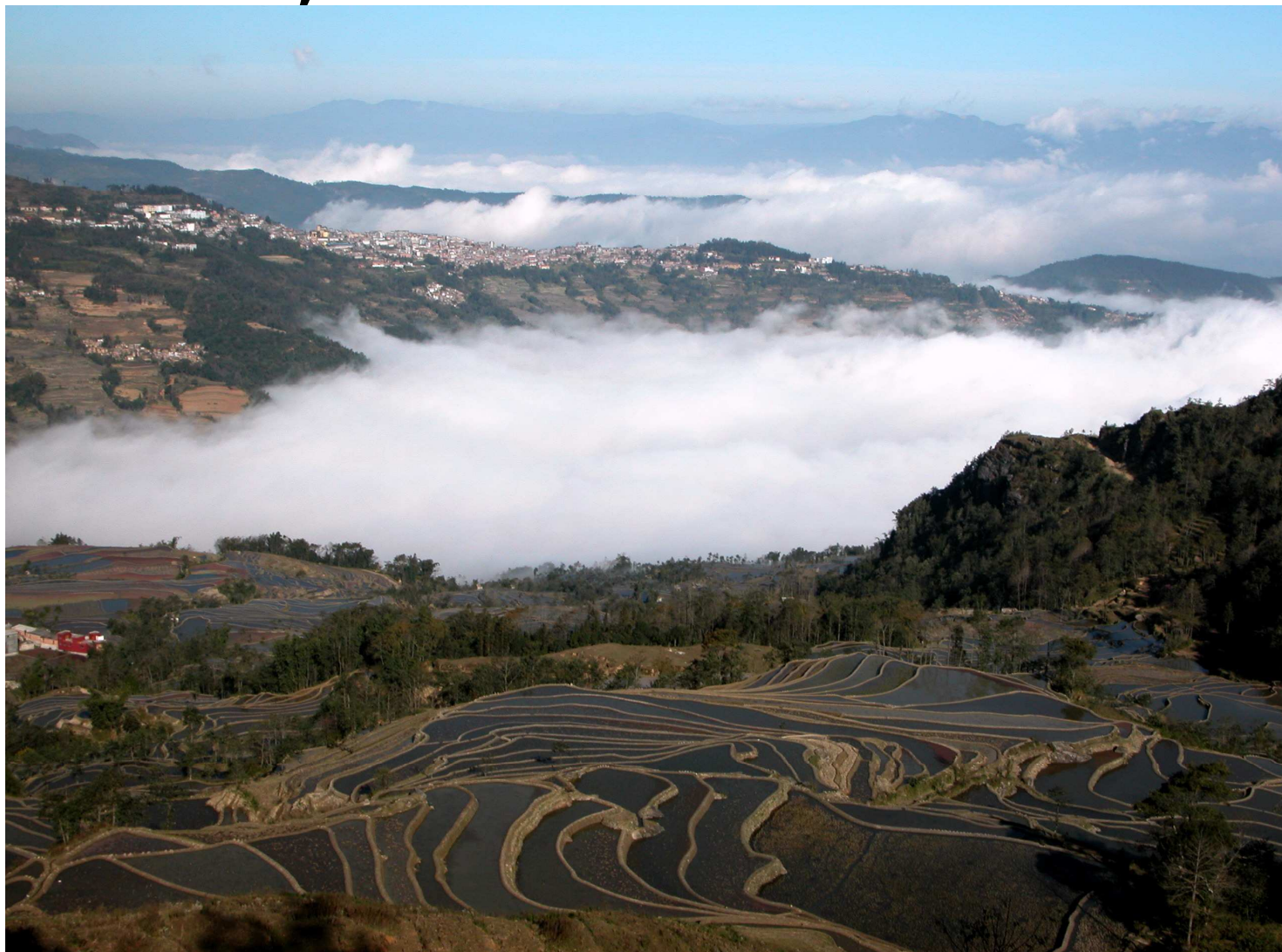
中国雲南省にある世界最大の棚田群「ハニ棚田群」のひとつ、多依樹棚田

旅行代金 288,000 円 新千歳・東京発着同額 ※他空港の発着はお問い合わせ下さい