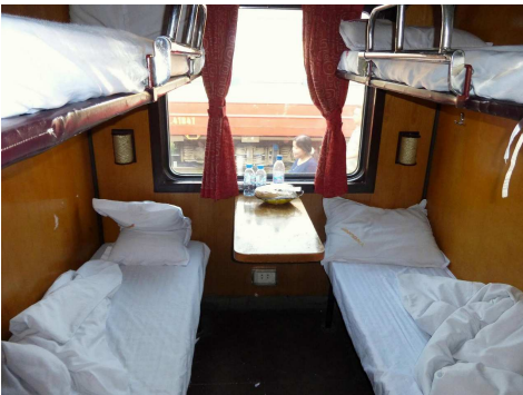
寝台車の4人用コンパートメント