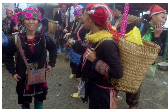
個性的な民族衣装を着たサパの少数民族の女性たち