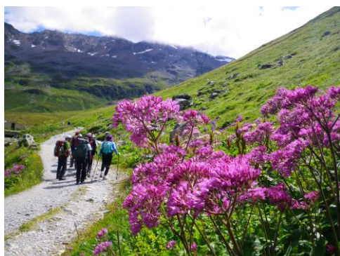
8月下旬でも色とりどりの高山植物が見られる

モンブランやグランドジョラスなど、毎日表情を変えるアルプスの名峰群を眺めながら、それぞれに景色の異なる谷を訪ね歩くこの素晴らしいトレッキングコースは、頭文字をとって略称「T.M.B.」とも呼ばれ、毎年、世界中からたくさんのトレkkerを集めています。日本では体験できない「歩いて国境を越える山旅」を是非お楽しみ下さい！