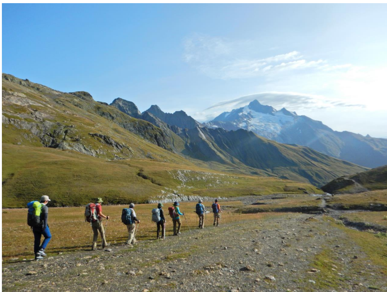
エギーユ・テュ・グラスエを眺めながら