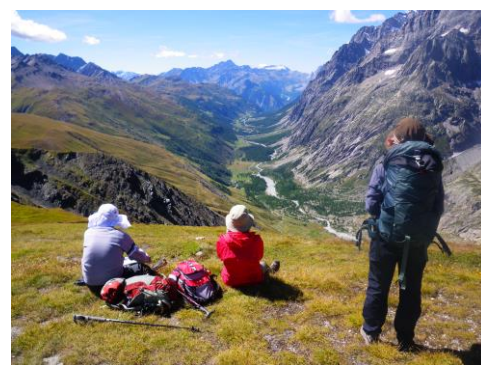
フェレの谷を振り返る