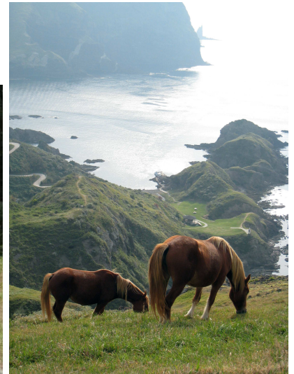
▲国賀海岸ハイクでは野生馬が草を食むのどかな風景が見られることも(西ノ島)