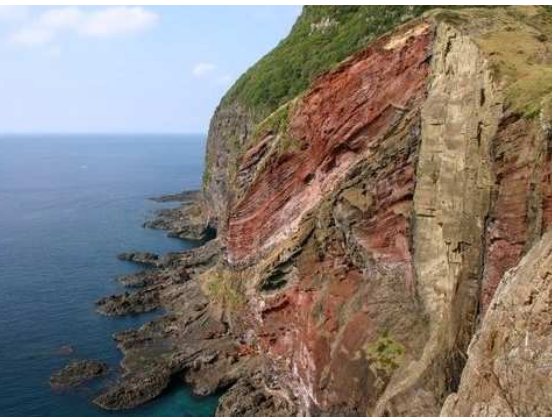
▲紺碧の海にざつりとえぐられた赤茶色の海蝕断崖がダイナミックにそびえる赤壁(知夫里島)

西ノ島、中ノ島、知夫里島の3島に上陸。海蝕断崖が約 7 km も続く国賀海岸や赤壁など世界ジオパーク登録の絶景を満喫