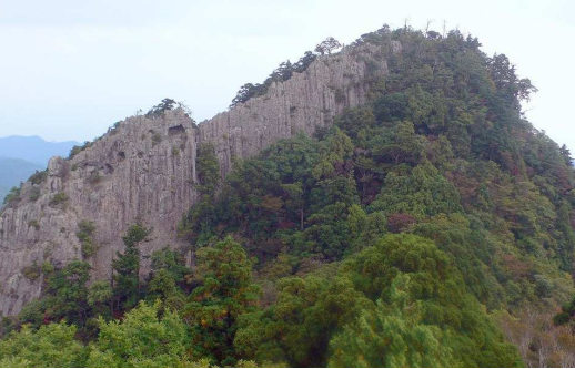
▲展望台から望む鷲ヶ峰の屏風岩 (自然回帰の森ハイキング)

緑豊かな自然林を歩き、奇岩奇峰の山並みを眺めるハイキングへ 今に伝わる史跡旧跡を訪ね、伝統文化「牛突き」も観賞