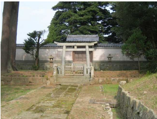
▲後鳥羽天皇御火葬塚。天皇が配流され崩御された海士町には、ゆかりの史跡が点在しています(中ノ島)