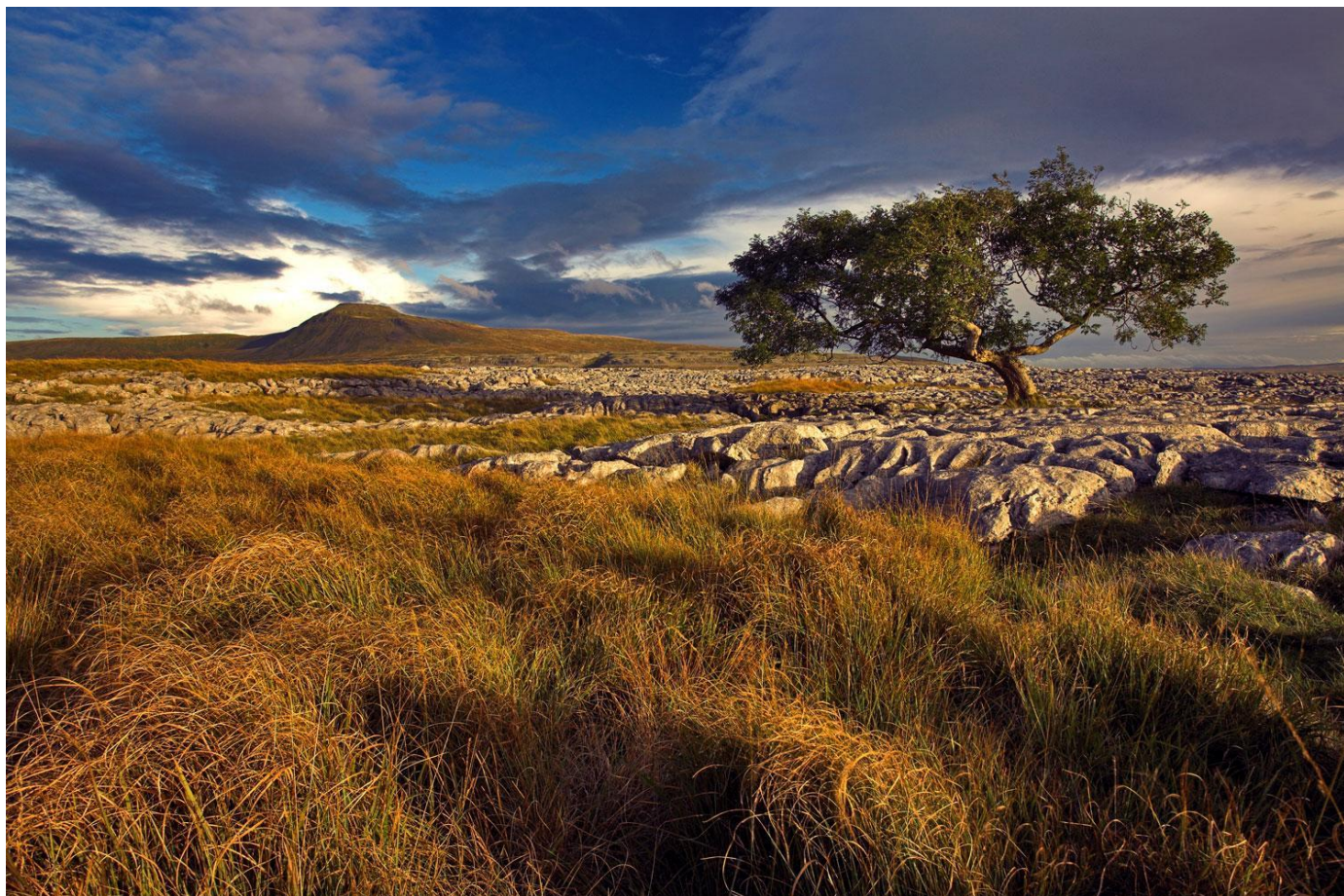
ヨークシャーデイルズの風景（イメージ）

コースト to コースト (C2C/East) は、ヨークシャーデイルズの丘陵地帯とムーアランド(湿地)がメインです。ペナイン山脈のふもとの街、カービースティーヴンからスタートし、東海岸の北海に面したロビンフツズベイでフィニッシュとなります。すでにC2C/Westを踏破した方にとってC2C/Eastは特に後半、茫漠とした平坦とも言える道のりが新鮮であると同時に、時に物足りなさを感じるかも知れません。しかしながら、決して一筋縄ではいかない玄人好みのトレイル~それこそがコースト to コースト/East です。このロングトレイルは、間違いなく世界でも指折りの素晴らしいコースと言えるでしょう。本来このコースは歩行日数が7日間に設定されており、毎日20km~36km歩くのですが、弊社では疲労を軽減するため日数を2日増やし14km~26kmとしました。さらに、途中に休養日を一日設けて体力に回復を図ります。歩行レベルは★★★★(中級)、ペナイン山脈を越える前半はアップダウン、後半は比較的平坦な道りを9日間歩きます