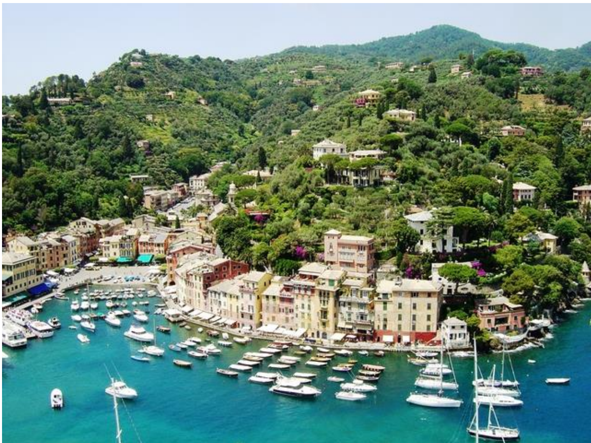
ポルトフィーノのハーバー