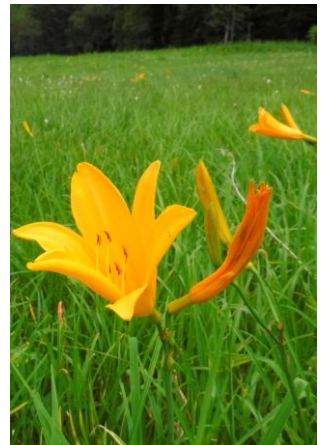
夏の尾瀬と言えばニッコウキスゲ