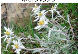
ホンシバヒナウススキソウ