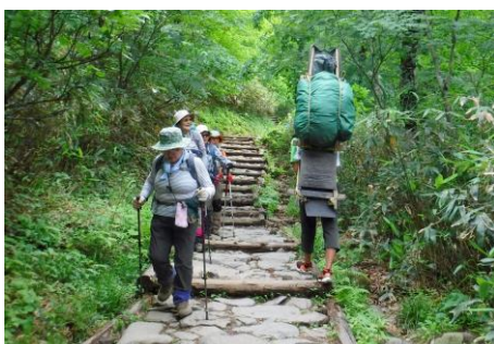
ポッカさんが通る