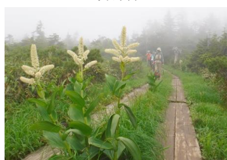
オヤマ沢田代(至仏山)