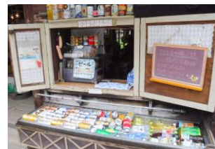
売店や土産店も(尾瀬沼)