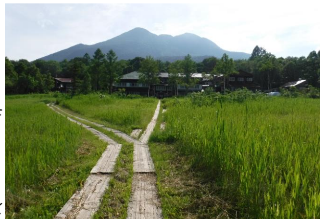
龍宮小屋と燧ヶ岳(2,356m)