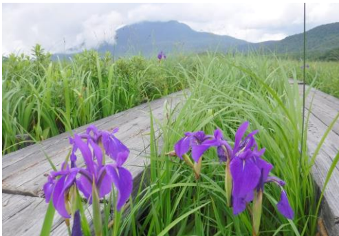
カキツバタ(アヤマ)も多い

※歩行の行程は原則として上記を予定しておりますが、現地事情により入れ替えや変更が生じる場合があります