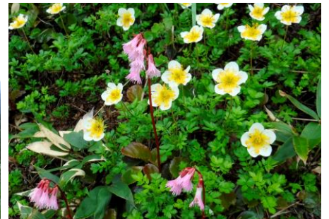
チングルマとイワカガミ