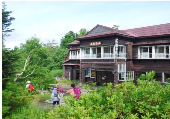
尾瀬の山小屋は「旅館」に近い