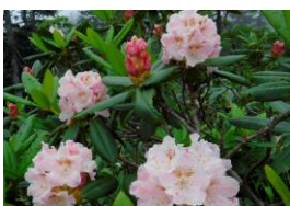
ネモトシャクナゲ