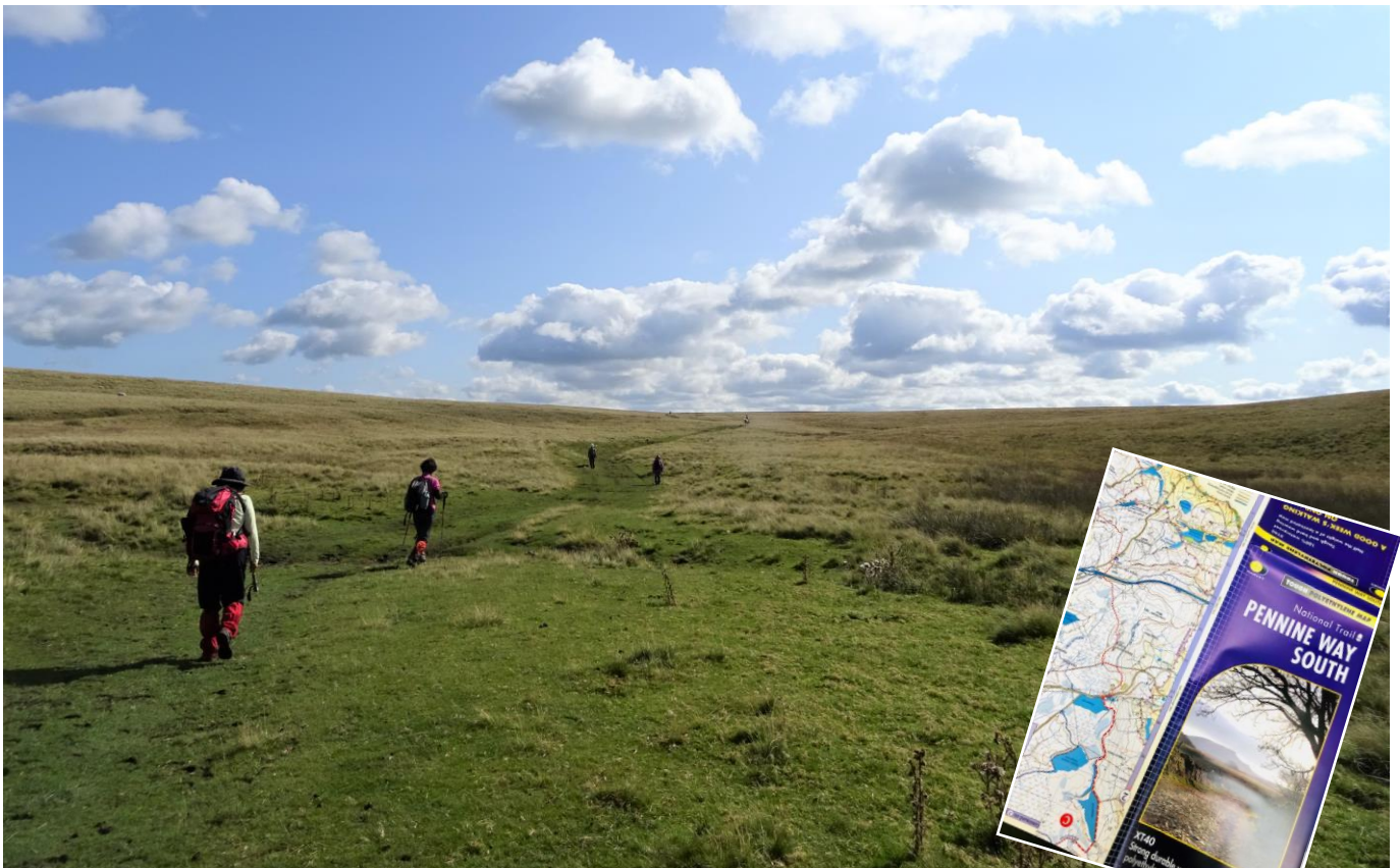
広大なヨークシャーデールズの風景 (イメージ)