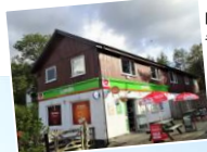
Lonsisで ランチを仕入れる