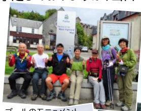
ゴールのモニュメント