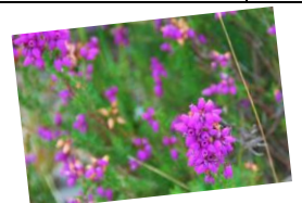
ヒースの丘を構成するエリカ