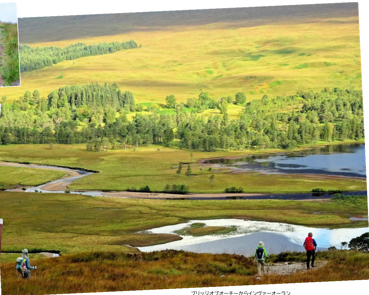
ブリッジオブオーチャーからインヴァーオーラン