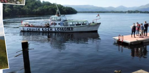
ローモンド湖のポート