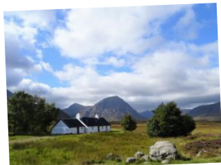
グレンコーの風景

※歩行の行程は原則として上記を予定しておりますが、当日の状況、現地の事情により変更する場合があります