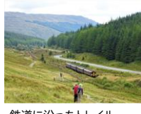
鉄道に沿ったトレイル