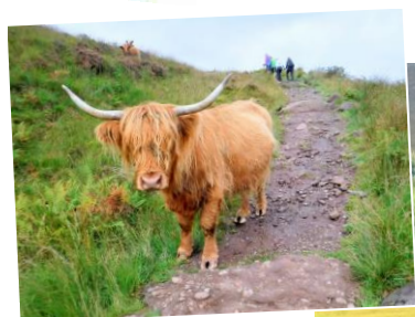
ハイランドキャトル