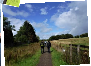
ダムゴイン軌道跡のトレイル