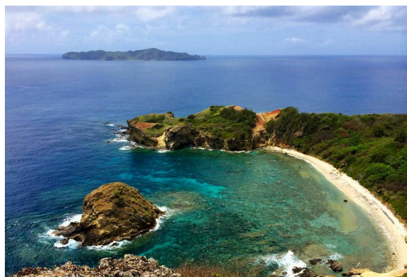
↑母島の南端、小富士から見渡す紺碧の大海原