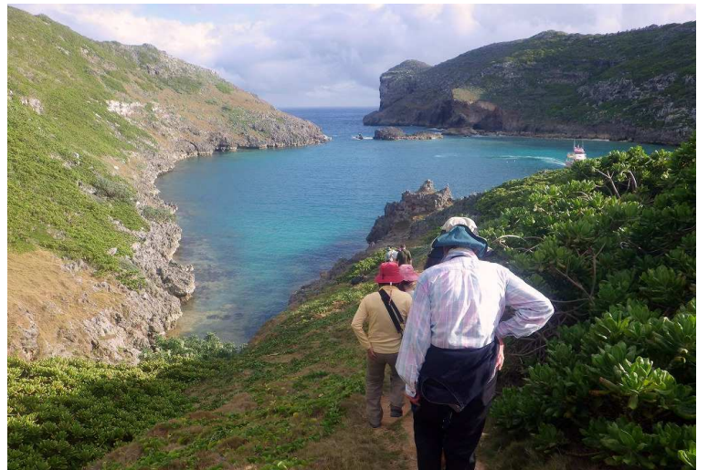
↑自然保護から1日の上陸者数が100人に制限されている無人島の南島に上陸します。海ガメの産卵地としても知られる貴重な島です

[利用予定航空会社] 日本航空、全日空、エアドゥなど [利用予定ホテル] ヴィアイン東京大井町(都内)、ブーゲン(父島)、クラフトイン・ラメーフ(母島)または同等クラス [食事] 朝4回(3回)・昼(弁)3回・夕2回 [最少催行人数] 4名 (最大6名) [一人部屋追加料金] 設定なし [おがさわら丸の船室ランクアップ料金] 往復とも基本は2等寝台(エコノミーベッド)となります。船室ランクアップをご希望の方は下記追加料金にて承ります(おひとり片道料金) ●特等(定員2名)44,000円 ●特1等(定員3名)37,000円 ●1等(定員2名)23,000円 ●特2等(寝台)10,000円 [添乗員] 新千歳空港から全行程同行。父島のハイキングやナイトツアー(OP)には地元ガイドも同行します。母島ではご希望のプランにより現地にてガイド手配が可能です。