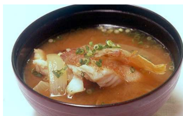
↑島の郷土料理も楽しみです。写真はアカバ(アカハタ)の味噌汁