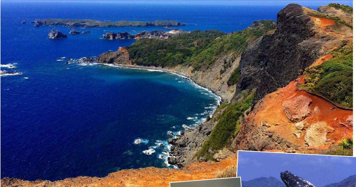
↑父島では南端の断崖絶壁「千尋岩(通称ハートロック)」へ。柵も何も無い高さ約200mの断崖からの眺めは圧巻です