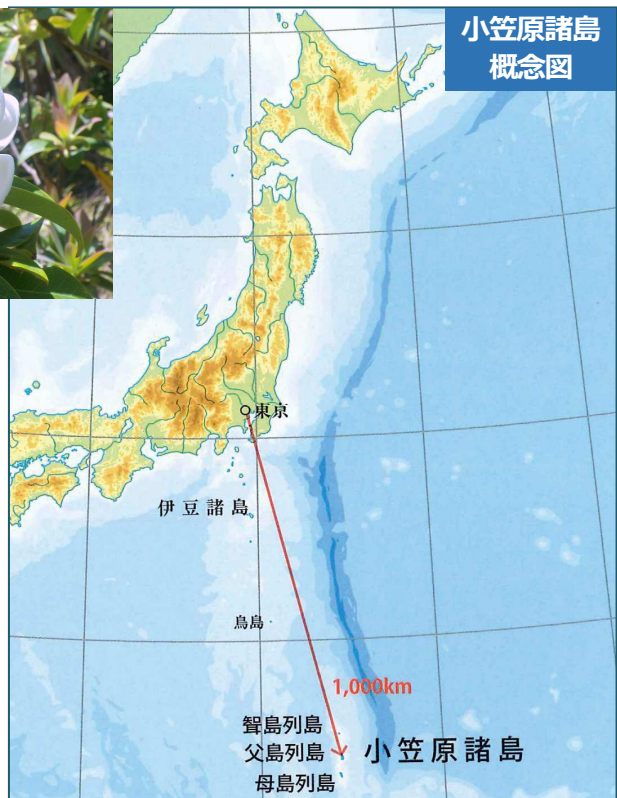
小笠原諸島 概念図