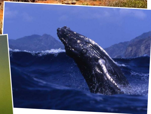
↑2月~4月下旬はザトウクジラが見られるベストシーズン(イメージ) ←母島列島の固有種ハハジマメグロに出会える可能性もあります(イメージ)