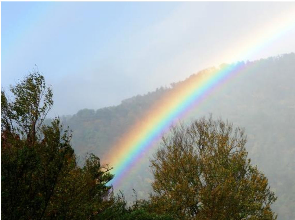
聖なる山に虹が出る

石鎚山(いしづちさん 1,982 m)は、四国山地西部の四国、および西日本の最高峰である。愛媛県西条市と久万高原町の境界に位置する。石鉄山、石鉄山、石土山、石槌山とも表記され、「伊予の高嶺」とも呼ばれる。『日本霊異記』には「石槌山」と記され、延喜式の神名帳(延喜式神名帳)では「石鉄神社」と記されている。山岳信仰(修験道)の山として、また日本百名山かつ日本七霊山のひとつともされ、「霊峰石鎚山」とも呼ばれる。正確には、最高峰に位置する天狗岳(1,982 m)・石鎚神社山頂社のある弥山(みせん 1,974 m)・南尖峰(なんせんぼう 1,982 m)の一連の総体山を石鎚山と呼び、古くから山岳信仰の山とされ、奈良時代には修行道場として知れ渡った。その後も山岳仏教や修験道の発達に伴い、信仰の拠点として現在までその地位にある。[ちなみに日本七霊山の残る六峰は、富士山、立山、白山、大峰山、釈迦ヶ岳、大山です]