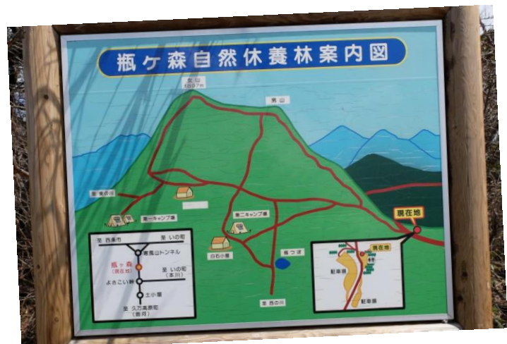
瓶ヶ森のトレイル案内図