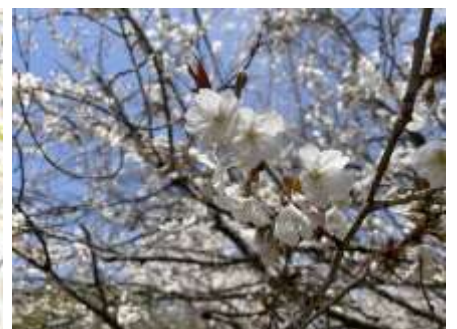
ソメイヨシノほか数種類のサクラ