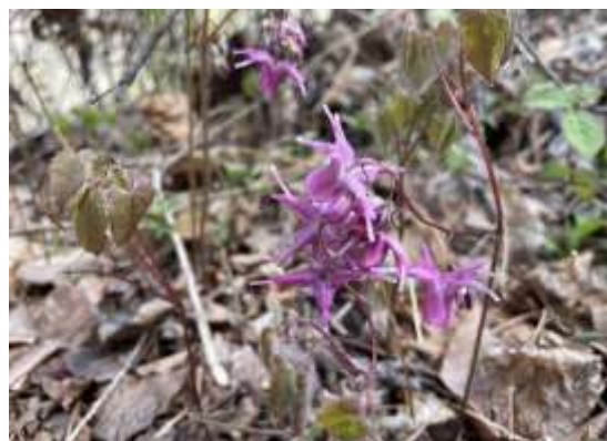
春のお花の代表格カタクリ