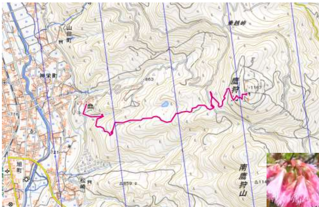
鷹狩山コース概念図

※歩行の行程は原則として上記を予定しておりますが、現地事情により入れ替えや変更が生じる場合があります