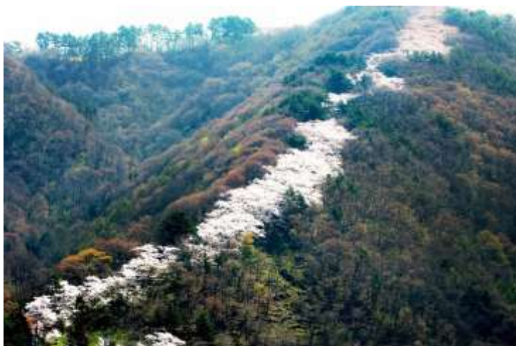
光城山「昇り龍」の尾根

長野県安曇野市にある光城山(ひかるじょうやま)は、標高は912m、最大の見どころは“昇り龍”とも称される、尾根上に登山口から山頂まで続く桜並木です。約2000本の桜が登山道を彩り、シーズンには満開の桜を見ようと多くの登山者が訪れます。残雪の北アルプス表銀の大展望を楽しみ、山頂から隣の長峰山(ながみねやま・標高933m)への縦走コースも魅力です。晴れば青空と桜が絶妙のコントラストを見せます。縦走コースの終着点、長峰山の山頂から望むのは、安曇野市を抱くようにそびえる北アルプス。文豪・川端康成も絶賛したと言われる光景をぜひご覧ください！