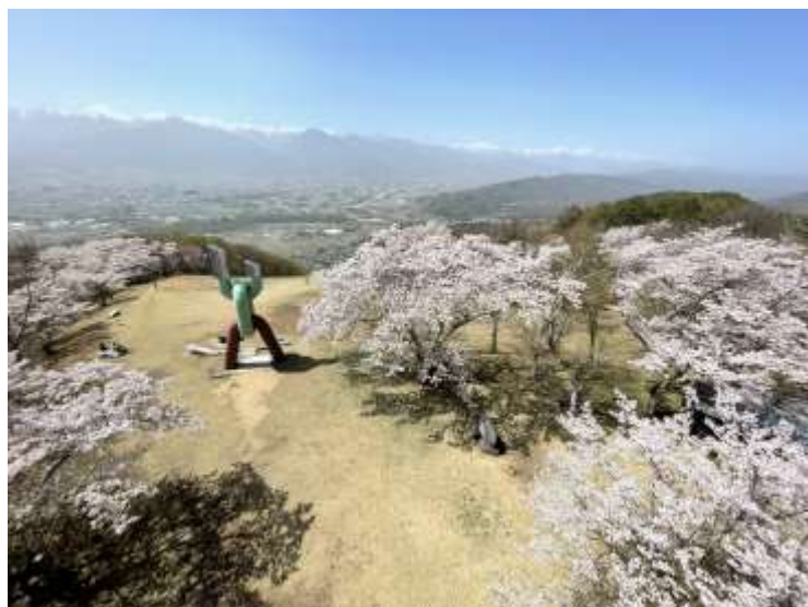
長峰山頂上からの展望も抜群