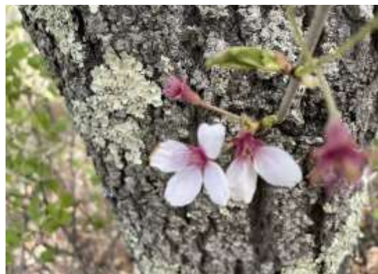
桜の季節、至る所に咲く