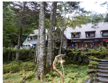
登山ベースとなる北沢峠には何件か山小屋があります(写真はこもれび山荘)

◀雄大なカールを従えた大山容と高山植物の豊かさから「南アルプスの女王」と称される仙丈岳