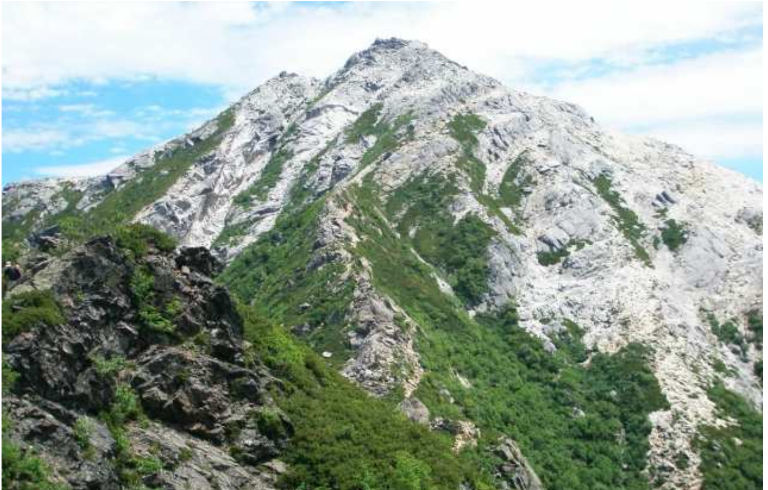
花崗岩の白い岩肌が雄々しい甲斐駒ヶ岳。日本各地にある“駒ヶ岳”の最高峰で、日本百名山の中でも特に人気の高い一座です

旅行代金 お一人様 185,000円 (新千歳発着) 145,000円 (伊那発着)