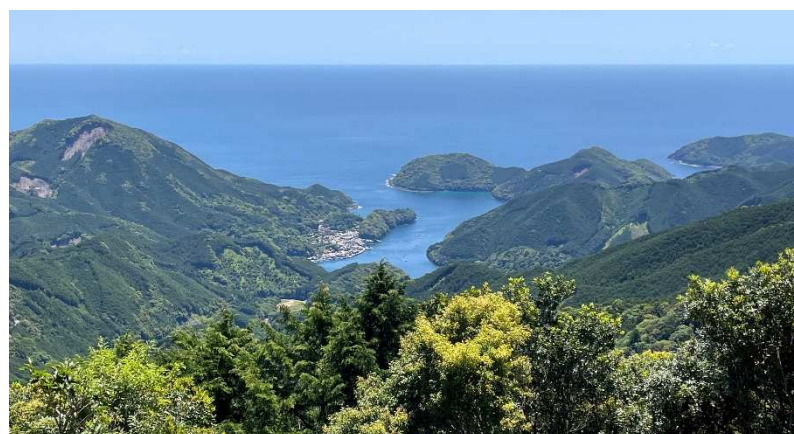
峠を越えて初めて目にする熊野灘の海原に感動します(イメージ)