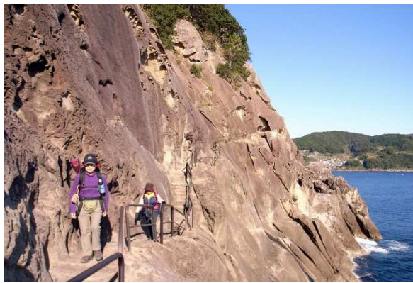
▲ 荒々しい海岸線の岩壁に沿って歩く世界遺産・鬼ヶ城 ▲ 七里御浜の奇岩・獅子岩