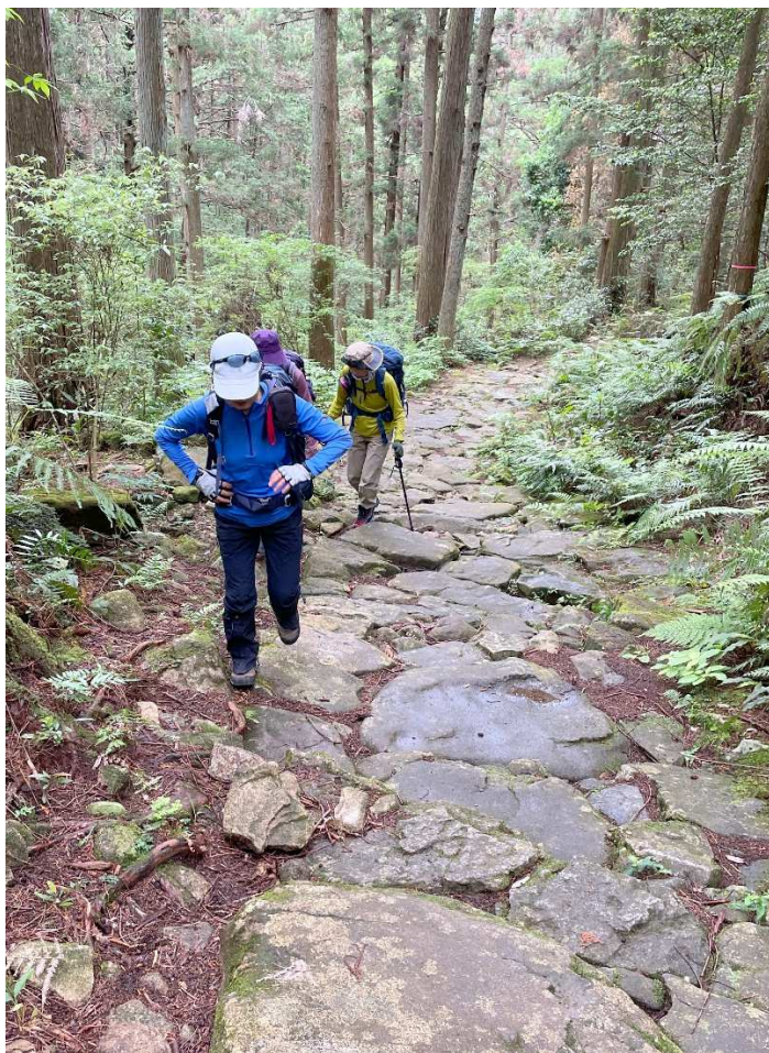
寛永年間、紀州藩によって整備され、伊勢路で最も美しいと言われる石畳が残る馬越峠越えの道(2日目)