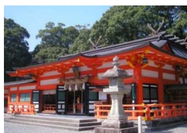
伊勢神宮▲の参拝からスタートして、熊野三山・新宮速玉大社▲でゴール