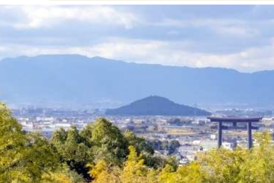
道から見渡す大神神社大鳥居と大和三山・耳成山