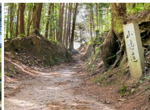
桧原神社周辺は歴史古道の趣が漂う