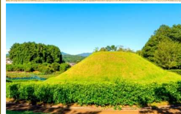
古代の謎とロマンがいっぱいの飛鳥路。 亀石(上)／高松塚古墳(下)