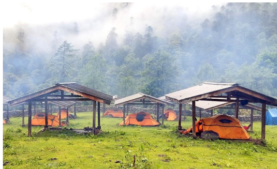
雨の多いミクサテンの幕営地は1テント毎に屋根付き

東ブータンの中心タシガンから専用車で標高約 3500m のメラへ入り、トレッキングスタート。ここからはプロクパ族など高地牧畜民が暮らすエリアです。彼らは一般のブータン人とは全く異なる生活、文化を持ち、衣装も個性的。特にヤクの毛で編んだ帽子は独特です。夏のこの時期は 4,000m 以上の高地でヤクを追いながら暮らしており、トレッキング中は彼らの様々な営みを目にする事ができます。トレッキングの最高所は標高約 4,100m のナチュンラ峠なので高山病の心配は比較的少ないでしょう。この峠の周辺は花の宝庫で、そろそろ終わりの青いケシ、日本では見られない大型のリンドウや様々な種類のサクラソウが見られる可能性があります。2日目、標高約 3,000m のミクサテンのみテント泊となりますが、あとの3泊は村の民家に宿泊し、高地牧畜民の暮らしを体験します。トレッキングの最終目的地、標高約 2800m のサクテンはメラ・サクテン地域の行政の中心地。ここに2泊して村周辺のミニトレッキングも楽しめます。現地の花や動物に詳しい日本語ガイドが当日のおすすめのコースにご案内します。運が良ければレッサーパンダや美しいニジ雉に出会えるかもしれません。コースは村々の往還道として概ね歩きやすい道ですが、岩場や滑りやすい急坂、ぬかるみもあるので、しっかりとしたソールのトレッキング靴が必要です。また花のシーズン=雨季なので、雨具、スパッツなど雨対策は万全にお願いいたします。