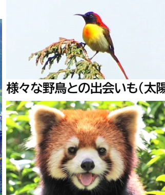
様々な野鳥との出会いも(太陽鳥)