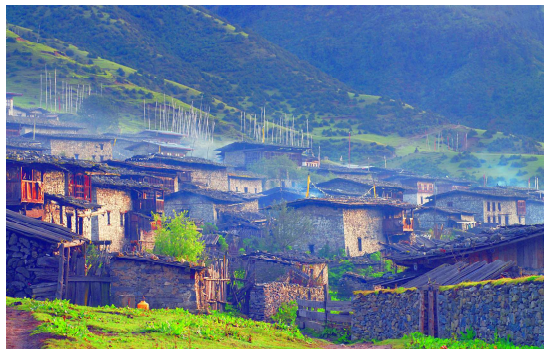
高地牧畜民の石積みの家が建ち並ぶサクテンの村