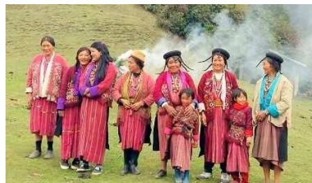
独特の文化を持つプロクパ族