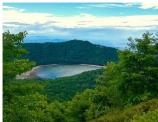
地藏岳山頂から小沼を展望