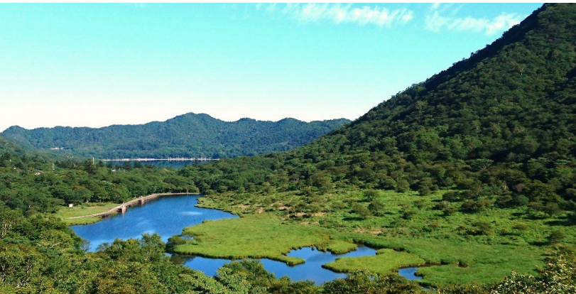
赤城山登山の1日目は寛満淵の木道を散策してフィニッシュ