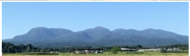
赤城山はその名のピークは無く、複数の峰から成るカルデラ地形の火山群