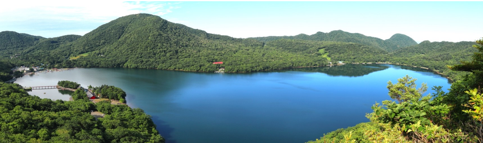
赤城山主峰・黒檜山への登路の猫岩付近からは大沼と地藏岳を一望

※交通 / → 航空機 ⇐ バスまたは専用車 鉄道 ⇐⇐ wv ロープウェイ、リフト … 徒歩(登山) ※記載の歩程の時間は休憩を除いた実質歩行時間の目安です。当日の天候や皆様の歩くペースによって前後します。 ※登山に不要な荷物は宿、または登山口施設や駅のコインロッカーに預けて行きます。 ※3日目の朝食と、登山中の昼食・行動食・飲み物は各自となります。昼食は登山中に食べられる携行食をご用意下さい。購入場所や購入時間については、ご参加者に改めてご案内します。