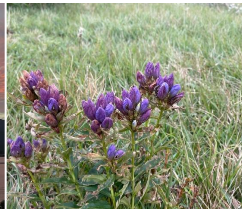
エゾリンドウの季節