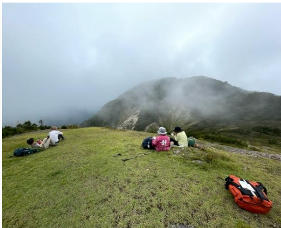
ガス湧く稜線で休憩