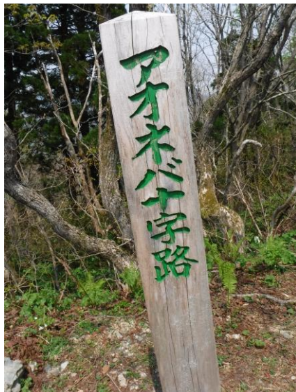
道標は充実している