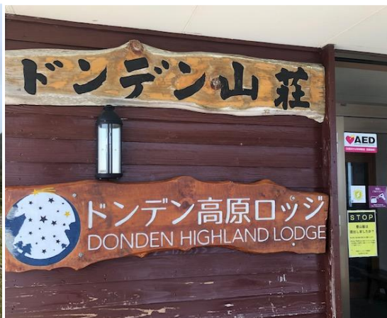
ドンデン高原ロッジ