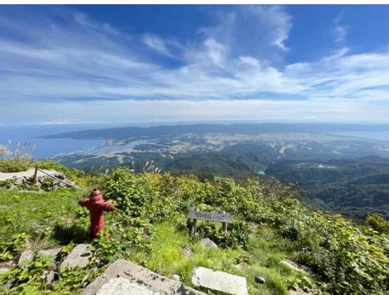
金北山頂上からの展望

※所要時間は休憩を除く歩行時間の目安です。当日の状況により変わりますのであらかじめご了承願います。