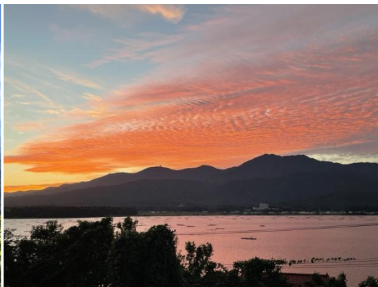
夕焼けに染まる金北山と加茂湖