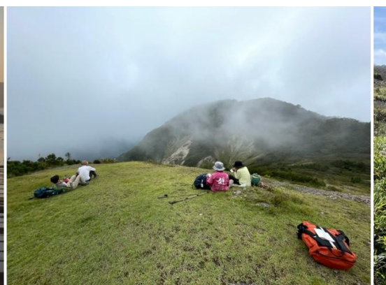
ガス湧く稜線で休憩