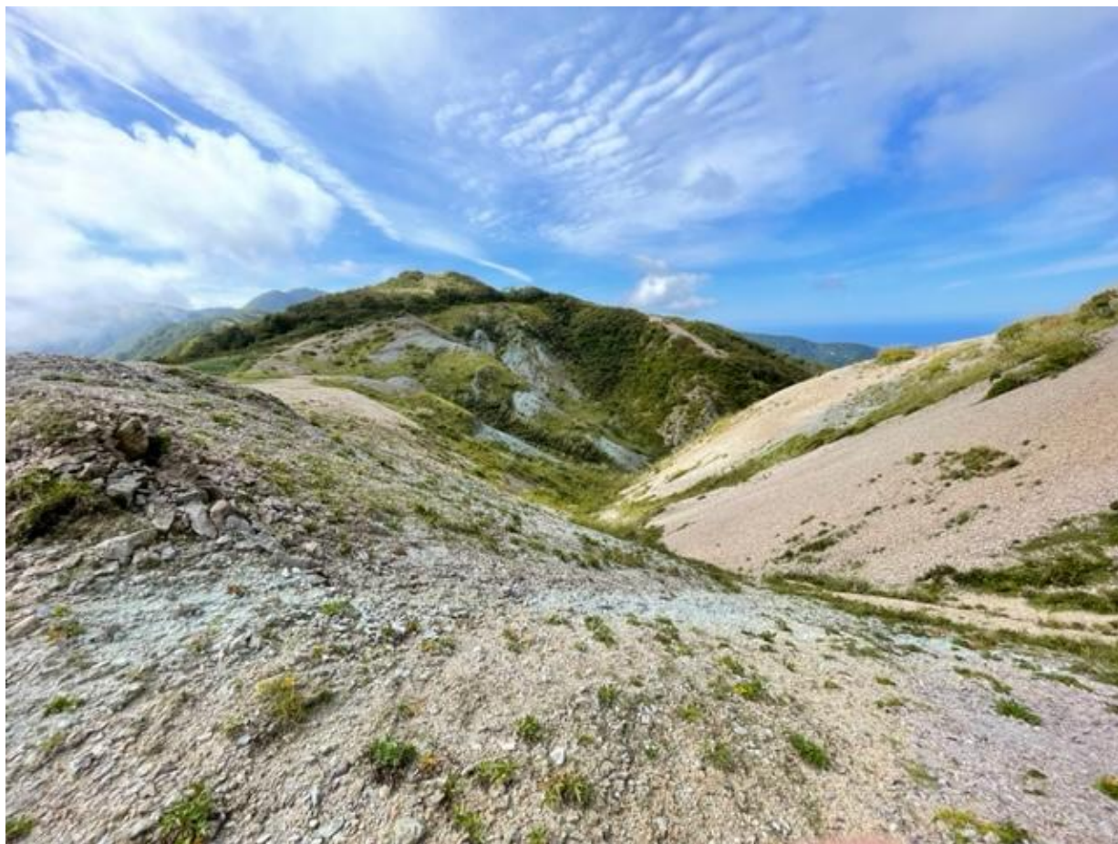
大佐渡山脈の主稜線