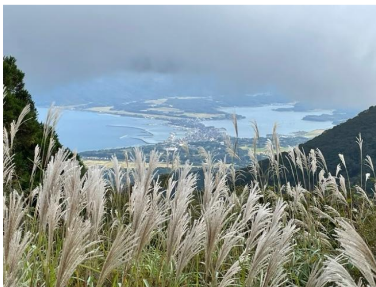
稜線から見る両津港と加茂湖方面

翌日はこの旅のハイライト、佐渡島の最高峰「金北山」を含む大佐渡山脈の縦走です。アオネバ十字路から最初のピークとなる「マトネ」を越え、さらにその先へ進むと、これから歩く稜線の山々はもちろん、左手には朝日に輝く国仲平野と日本海、右手には外海府がちらりと見え、まさに島のてっぺんを歩いていることを実感します。樹林帯と開けた稜線を交互に歩きながら、イモリ平、天狗の休場、役の行者など印象的なポイントを経て、金北山へと向かいます。コース全体にアップダウンがあり、歩きごたえは十分です。辿り着いた金北山頂上からの大展望は言うまでもありません。最高峰を満喫したら、少し戻って神子岩を経由し、沢口あるいは栗ヶ沢に下山、もしくは頂上から直接つながる自衛隊道路を歩いて白雲台に下山します。