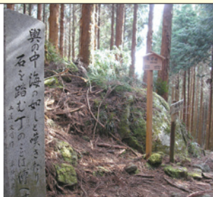
近露王子が置かれた近露集落を見おろして