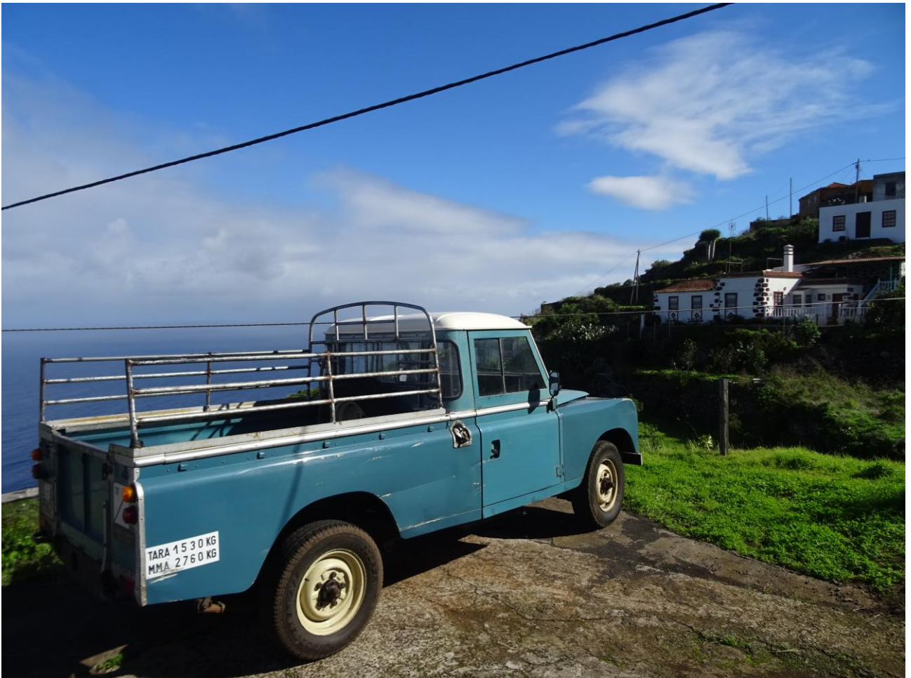
大西洋に浮かぶ島の暮らし (イメージ)