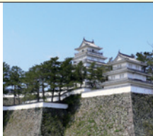
天草四郎殉教の地・原城跡 (国指定史跡)