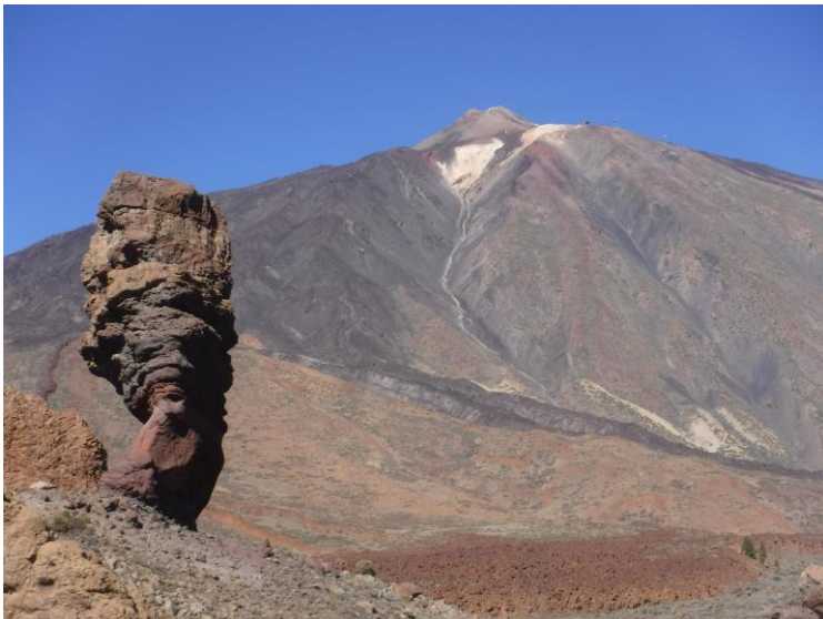
奇岩が目を惹くテイテ山麓のロケ・テ・ガルシア