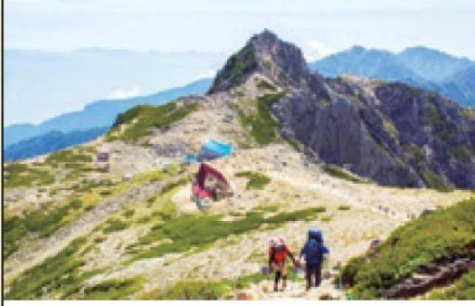
宝剣岳を眺めながら木曾駒ヶ岳へ

①新千歳または各地→中部または羽田=駒ヶ根=しらび平++千畳敷(2,612m) ②…八丁坂…乗越浄土(2,858m)…日本百名山木曾駒ヶ岳(2,956m)…馬ノ背…濃ヶ池(逆さ宝剣岳を映す氷河湖)…駒飼ノ池…乗越浄土…千畳敷(約6h)++しらび平=駒ヶ根 ③≡天竜峡(ライン下り)…渓谷遊歩道ハイキング…天竜峡大橋そら散歩…天竜峡温泉(約2h) ④=飯田=中部または羽田→新千歳または各地