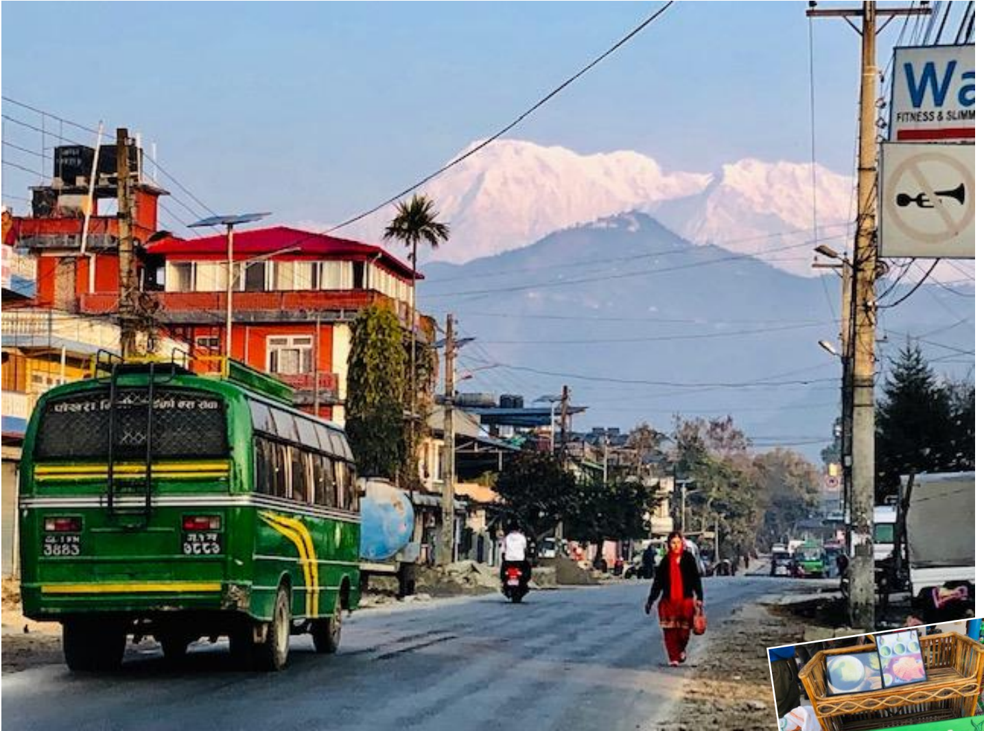
アンナプルナ連峰を望むネパール第2の町ポカラ