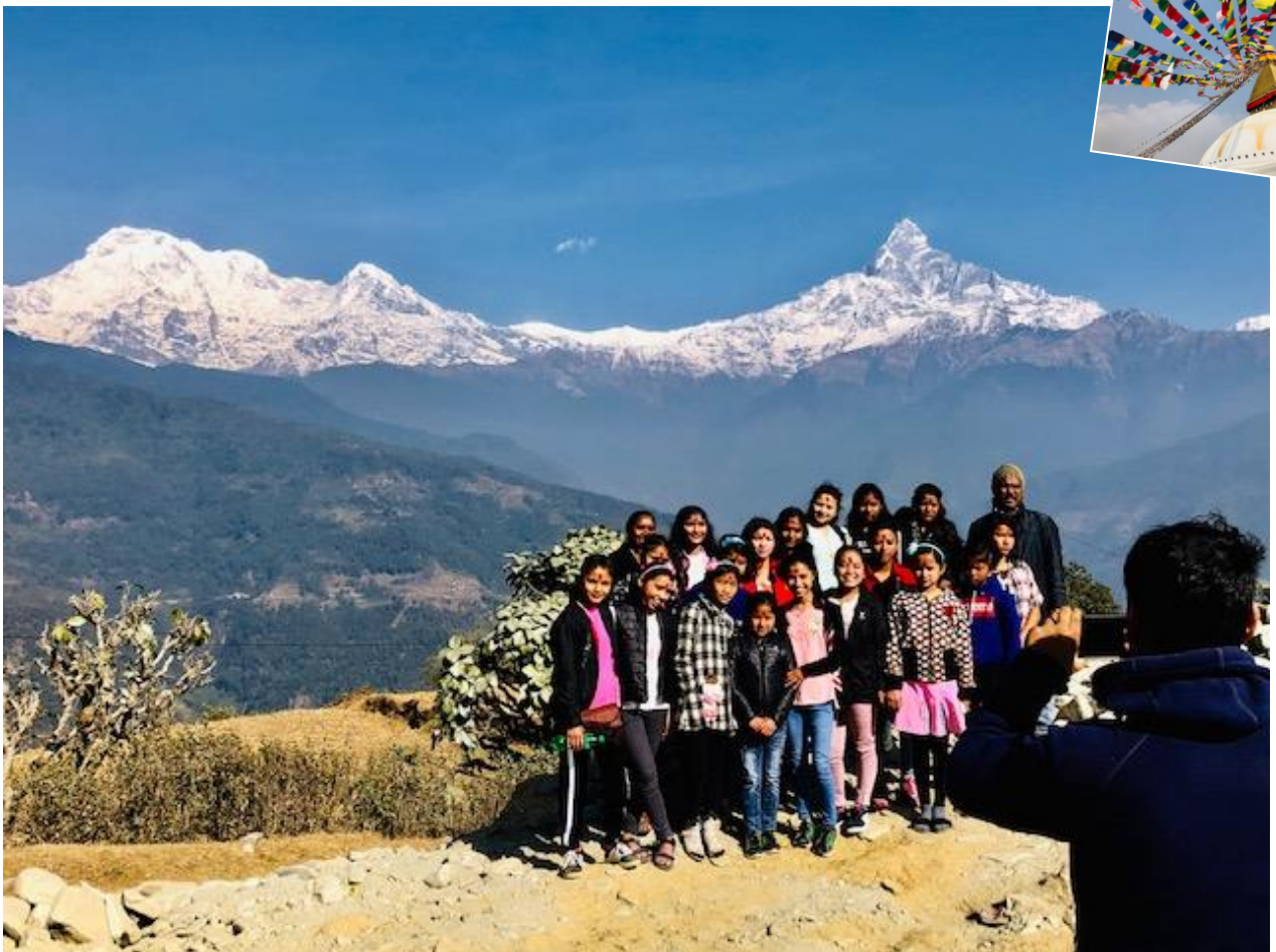
ダンプスから望むアンナプルナとマチャブチャレ峰