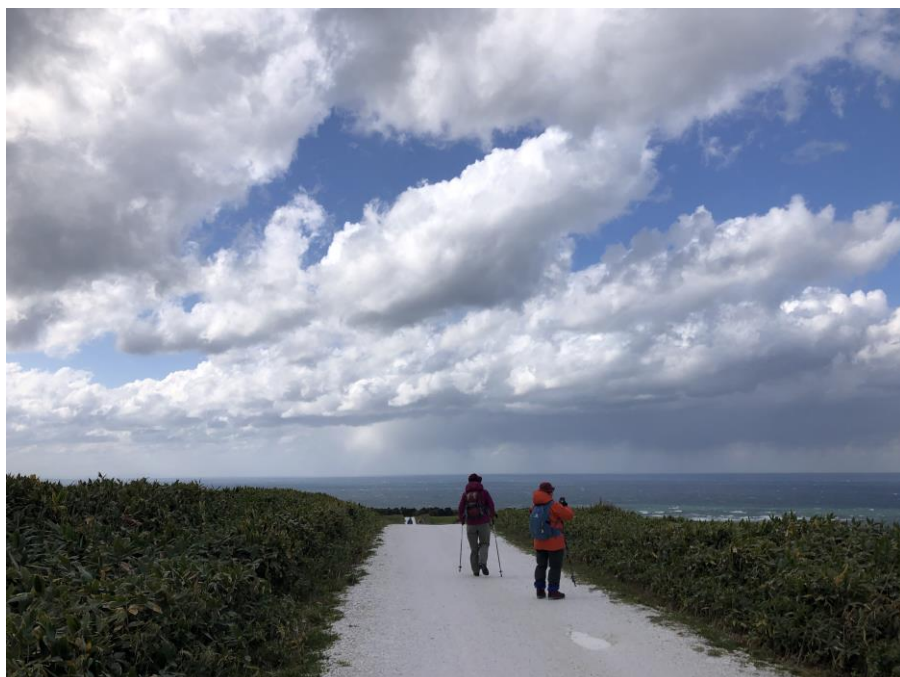
宗谷丘陵の「白い道」