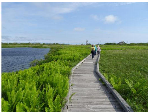
サロベツ湿原の木道