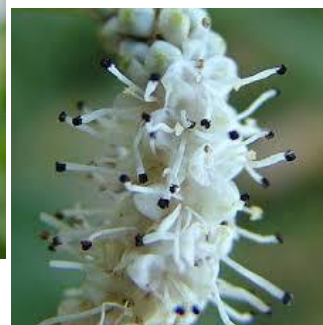
シロワレモコソウ