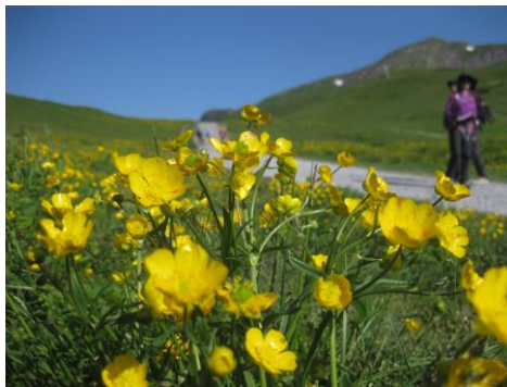
ランクルス・モンタヌス(キンポウゲ)