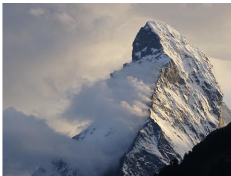
雲を纏うマッターホルン(ツェルマット)