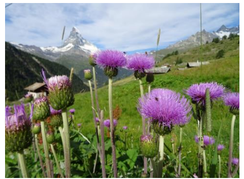
キルシウム(スネガ)