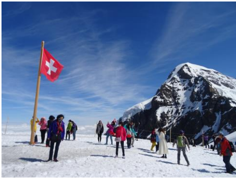
ユングフラウヨッホ

国境を越えてフランスへ。アルプス最高峰モンブラン山麓、シャモニーモンブランの街がベースです。ミディ針峰、ドリユ針峰、シャモニ針峰、ルージュ針峰、そしてメールドグラス氷河の奥に幾多の山岳ドラマを生んだグランドジョラス北壁などを見ながら、高山植物の多い快適なハイキングトレイルを楽しみます。国際色豊かな山岳リゾートでの観光やショッピングも楽しみです。