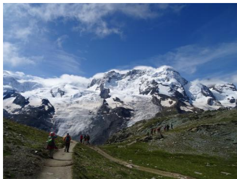
ブライトホルンを見ながら(ゴルナーグラード)