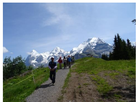
ザ・ノースフェーストレール