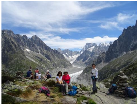
メールドグラス氷河とグランドジョラス