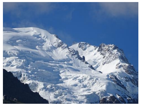
ボツソン氷河(モンブラン)