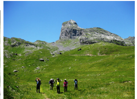
特異な岩峰を望むアルプで