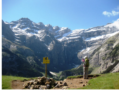
正面に大圏谷を見ながら

ガヴァルニー圏谷(Cirque de Gavarnie)は、氷河の侵食によって形成されたU字谷で、谷底から立ち上がる壁の高さは約 1,500m に達します。その南にそびえる標高 3,352mのモン・ペルデュには、氷河が見られます。ピレネー山脈の山の中では 3 番目の高さを誇るその山頂自体はスペイン側にあります。●グラン・カスケード滝(Grande Cascade):ヨーロッパ最大の滝で落差は 422m。ガヴァルニー村からも良く見えます。