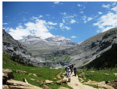
オルデサ渓谷最奥部

ピレネー山脈のスペイン側にある“オルデサ・イ・モンテ・ペルデイド国立公園(Parque Nacional de Ordesa y Monte Perdido)”は、標高 2,500m以上の高峰が連なる、美しく壮大な山岳地帯です。非常に豊かな生態系、変化に富んだ動植物相が見られ、トレス・セロルス山を主峰とするペルデイド山塊が山脈を形成しており、その麓にオルデサ渓谷をはじめとする渓谷群が広がっています。深い U 字谷の側壁から幾筋もの壮大な滝が流れ落ち、森林や高山植物のアルプに囲まれたピレネーを代表する美しい渓谷です。