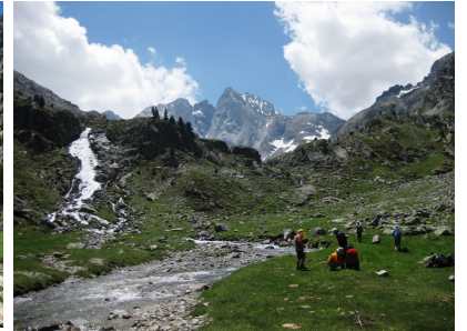
ビニューマーレ北壁を望むアルプで