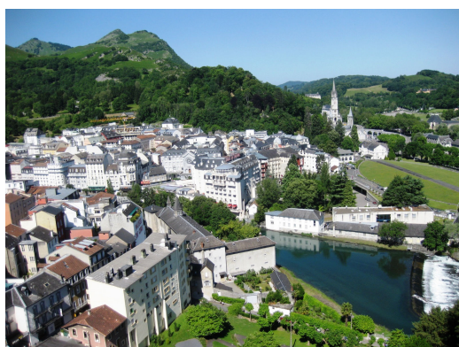
美しい街並みの聖地ルルド