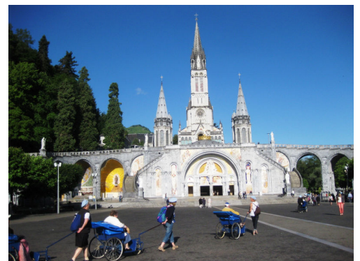
巡礼者が絶えないルルドの“聖域”

ルルドは、ピレネー山脈のふもと、フランス南西部人口 15,000 人ほどの小さな町です。聖母マリアの出現で、いくつもの奇蹟が起きたことで世界的に有名なキリスト教の聖地であるとともに、「ルルドの泉」でも広く知られ、カトリック教会の重要な巡礼地となっています。世界各国から年間 500 万人もの人々が奇蹟を求めて訪れます。訪れる人々の目的は礼拝だけではなく、同じ苦しみを持った人同士のコミュニケーション、そして、ピレネー山脈の自然とふれあうための拠点ともなっています。