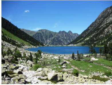
蒼い水を湛えるゴーフ湖

ビニューマーレ峰(Vignemale 3,298m)は、ピレネー山脈の氷河の中で 2 番目に大きなオツウ氷河を従える、フランスピレネーの最高峰です。歴史上重要なスペイン橋(Pon d'Espagne)からチェアリフトで乗り、ゴーフ湖(Lac de Gaube)に達すると、真夏でも壮大な氷河を従える山々を背景に、その周辺は高山植物が咲き誇る楽園のような風景を提供してくれます。オーレット小屋方面への数時間の往復ハイキングが魅力的。谷の奥にはピクニックに適した日当たりのよい美しいアルプが開け、小さな流れが開放的な雰囲気を作っています。