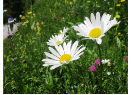
レウカンテムム・ハレリ(フランスギク)