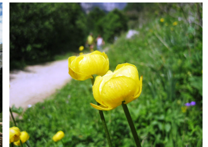
トロリウス・エウロパエウス(キンバイソウ)