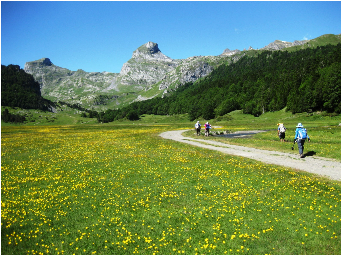
ピック・デュ・ミディ・ドゥソンのお花畑に行く

ガヴァルニー（フランス）とオルデサ（スペイン）各2連泊、カトリックの聖地ルルドにも1泊！ 色とりどりの高山植物が開花する季節、旅の最後はバルセロナへ！