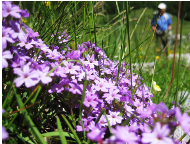
エリヌス・アルビヌス(イワカラクサ)

「頂上の尖った山」を意味するピック・デュ・ミディ(Pic du Midi)ドゥソ(D'Ossau)は、その特徴ある形が歯を連想させます。フランスピレネーにあり、標高は 2,884m メートル。遠く山麓の Aquitaine 平野からもその特異な山頂が望見できます。ハイキングはピオザールディーギュ湖の駐車場からスタート。方角によってはまるで 3 本の煙突がそびえているような鋭い景観を見せるドゥソ峰を背景に、山麓は高山植物の広大なアルプのお花畑です。