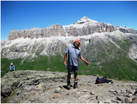
ベルヴェデーレの小ピークで

ドロミテの最高峰マルモラーダ(3343m)の麓に広がる風光明媚な谷ーそれがカナツェイの村を擁するファッサ谷とフィエンメ谷です。緑豊かな開けた斜面とその上に鎮座する、ポルドイやサツソルンゴなどの岩峰群が対照的です。このツアーでは、谷を俯瞰するカナツェイ・ペコルの1軒宿に2泊しますので、朝晩の光線によって刻々と色彩を変える美しい渓谷の風景が期待できます。時間があればカナツェイの村に下りて散策を楽しむ事もできます。