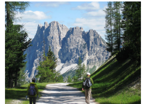
ファローリアからリオジェレハ

1956年冬季オリンピックが開催されたコルチナ・ダンペッツォは、上記二つのエリアに比べると随分大きな町と言う印象です。夏はハイキング、冬はスキーのために世界中から観光客が集まる、のんびりした山岳リゾートの雰囲気には溢れています。みやげ店も数多くショッピングも楽しみです。この主役は何と言ってもトレチメ(ドライチンネン)の3岩塔。目を疑うような巨大な岩塊に圧倒される事でしょう。