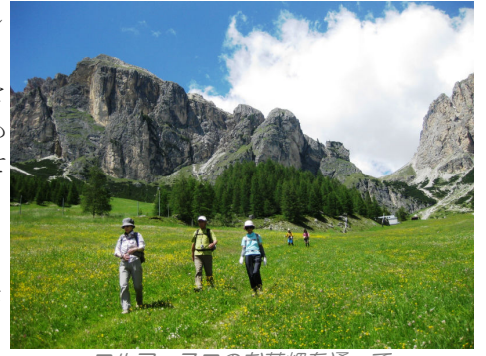
コルフォスコのお花畑を通過

“ドロミテで一番美しい谷”とも言われるガルテナは、3つの小さな村ーオルティセイ、サン・クリスティーナ、セルヴァーを擁し、周囲を特異な岩峰群に囲まれた、ドロミテ地方でも一際異彩を放つ谷です。特異な岩峰群、それは例えばサツソルンゴ、カティナチオ、ルドール、セラ…など、どの山も見る者を惹き付けて離さない魅力に溢れた岩の芸術品です。荒々しい山々の麓には咲き乱れる高山植物のアルプが広がります。歴史ある素朴な民家や教会も一見の価値あり！