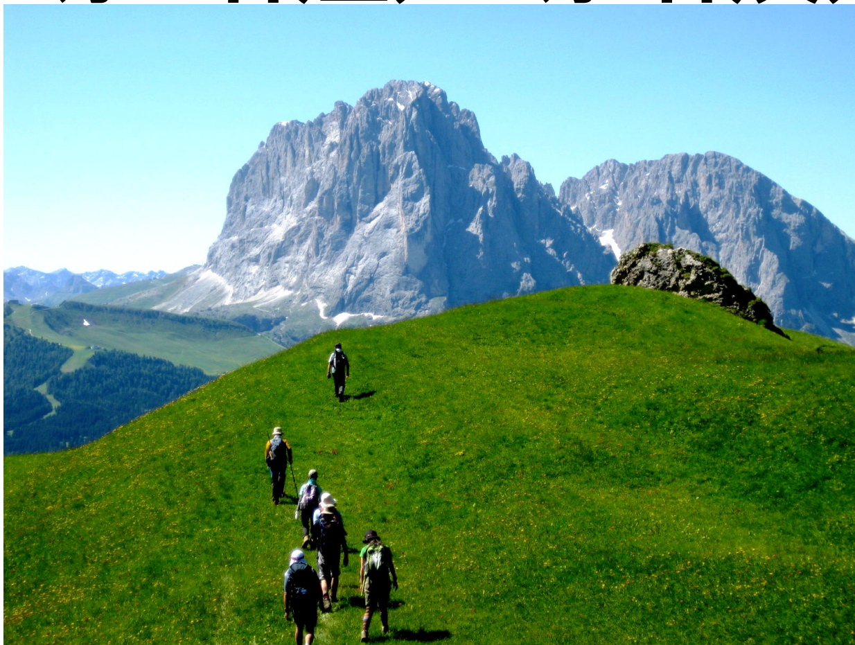
サッソルンゴ峰を見ながら

スイスアルプスを凌ぐほどの多彩な高山植物が一斉に開花する季節！ ヴァル・ガルデナ&コルチナ・ダンペッツォに3連泊、カナツェイに2連泊のゆったりステイ！