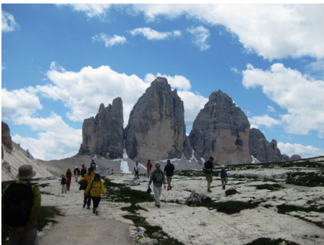
トレチメ(ドライチンネン)3岩塔

1956年冬季オリンピックが開催されたコルチナ・ダンペッツォは、上記二つのエリアに比べると随分大きな町と言う印象です。夏はハイキング、冬はスキーのために世界中から観光客が集まる、のんびりした山岳リゾートの雰囲気には溢れています。みやげ店も数多くショッピングも楽しみです。この主役は何と言ってもトレチメ(ドライチンネン)の3岩塔。目を疑うような巨大な岩塊に圧倒される事でしょう。