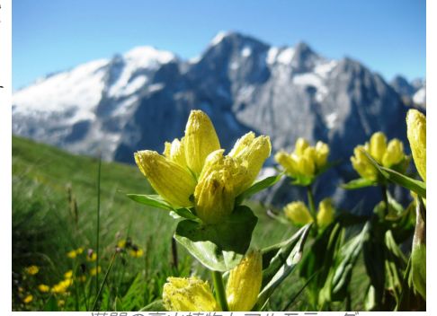
満開の高山植物とマルモラーダ

ドロミテの最高峰マルモラーダ(3343m)の麓に広がる風光明媚な谷ーそれがカナツェイの村を擁するファッサ谷とフィエンメ谷です。緑豊かな開けた斜面とその上に鎮座する、ポルドイやサツソルンゴなどの岩峰群が対照的です。このツアーでは、谷を俯瞰するカナツェイ・ペコルの1軒宿に2泊しますので、朝晩の光線によって刻々と色彩を変える美しい渓谷の風景が期待できます。時間があればカナツェイの村に下りて散策を楽しむ事もできます。