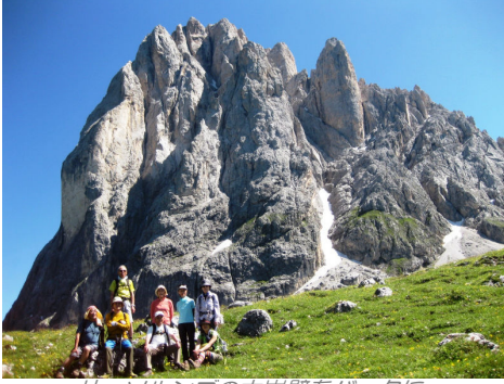
サツソルンゴの大岩壁をバックに

“ドロミテで一番美しい谷”とも言われるガルテナは、3つの小さな村ーオルティセイ、サン・クリスティーナ、セルヴァーを擁し、周囲を特異な岩峰群に囲まれた、ドロミテ地方でも一際異彩を放つ谷です。特異な岩峰群、それは例えばサツソルンゴ、カティナチオ、ルドール、セラ…など、どの山も見る者を惹き付けて離さない魅力に溢れた岩の芸術品です。荒々しい山々の麓には咲き乱れる高山植物のアルプが広がります。歴史ある素朴な民家や教会も一見の価値あり！