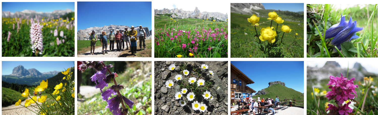
ドロミテのアルプに見られる高山植物群(例)

上記歩行時間は休憩、屋食等の時間を除いた実質歩行時間の目安です。ハイキングコースは状況により変更する場合があります。