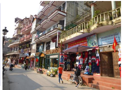
サバの町並みはフランス的

注目の秘境“サバ” ハノイから夜行列車で中国との国境の町ラオカイへ。そこから車で1時間。標高1600mのサバはベトナム屈指の避暑地です。町は、周辺に住むカラフルな衣装を纏った少数民族が行き交いのどかな雰囲気が漂っています。サバ郊外には、棚田が広がり“世界で美しい棚田7選”に選ばれた美しい景色の中、のんびりショートトレッキングを楽しみましょう。晴れた日には宿泊ホテルの正面に神々しいファンシーパン山群の展望をお楽しみいただけます。