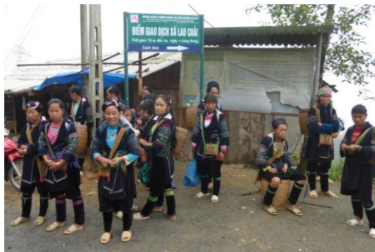
黒モン族のお嬢さんたち

注目の秘境“サバ” ハノイから夜行列車で中国との国境の町ラオカイへ。そこから車で1時間。標高1600mのサバはベトナム屈指の避暑地です。町は、周辺に住むカラフルな衣装を纏った少数民族が行き交いのどかな雰囲気が漂っています。サバ郊外には、棚田が広がり“世界で美しい棚田7選”に選ばれた美しい景色の中、のんびりショートトレッキングを楽しみましょう。晴れた日には宿泊ホテルの正面に神々しいファンシーパン山群の展望をお楽しみいただけます。