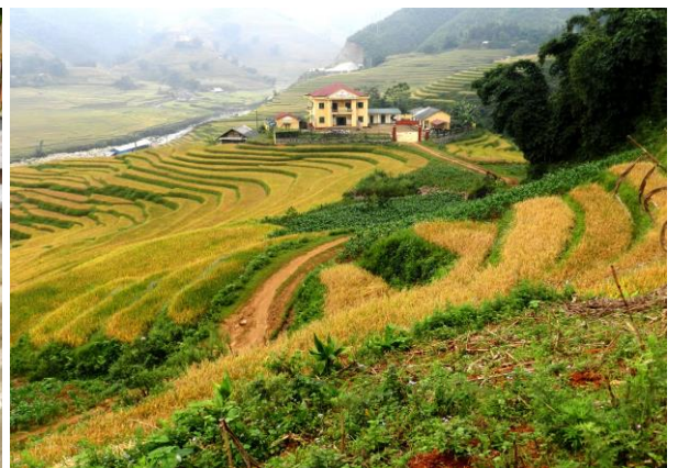
棚田7選”選ばれた美しい棚田