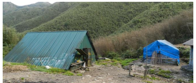
第2キャンプの風景。トタン屋根が宿舎です