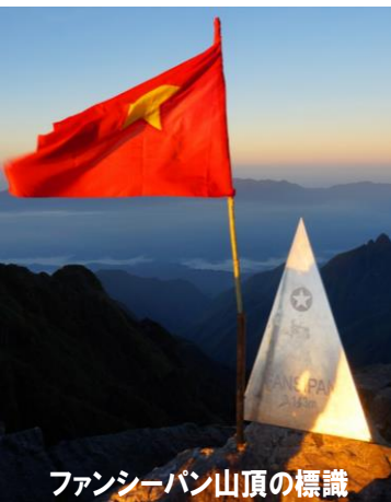
ファンシーパン山頂の標識

※歩程は休憩などを除いた実質歩行時間の目安です。 ※現地の事情により、交通機関、日程が変更になる場合があります。