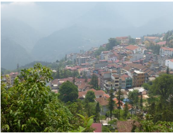
ハムロンの丘からサバを望む