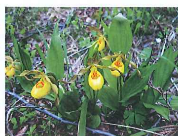
▲イエローレディーヌスリッパ(アツモリソウ)