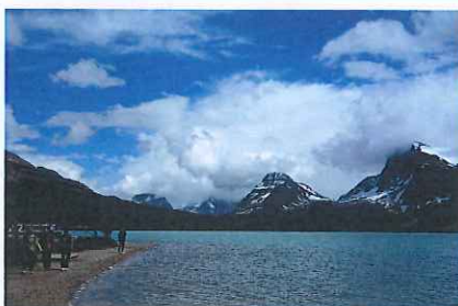
↑開放的な広がりポウレイク ←センチネルパスを望む コバルトブルーの水を湛えるペイトレイク