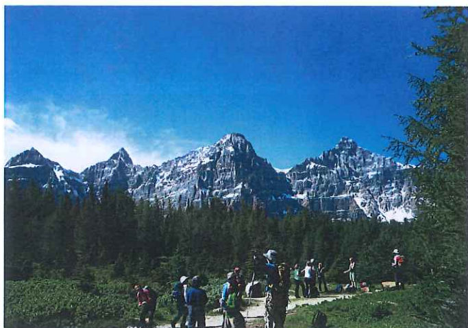
テンピークスを望むラーチバレー