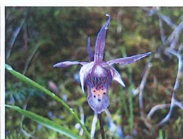
▲ディーナスリッパ(ホテイラン)