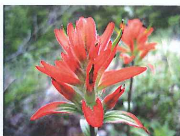
▲インディアンペイントブラシ(赤)