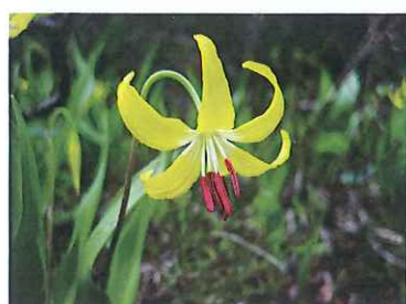
▲グレイシャーリリー(カタクリ)