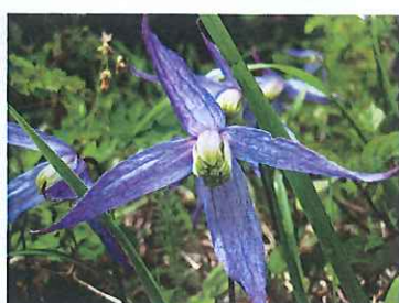
▲ブルークレマチス(センニンソウ)