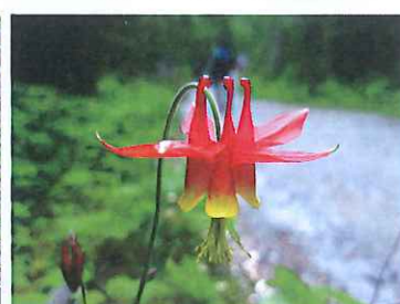
▲レッドフラワードコロンバイン(アダマキ)