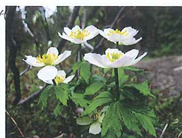
▲ウェスタンアネモネ