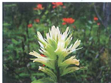
▲インディアンペイントブラシ(黄)

●上記歩行時間は休憩等を除いた実質歩行時間の目安です。ハイキングコースは状況により変更する場合があります。