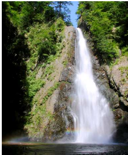
▲落差37mの豪快な直瀑・暗門第2の滝