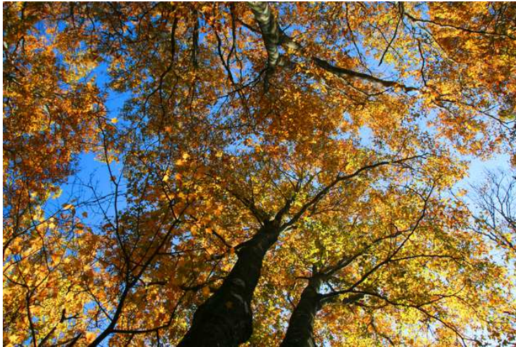
▲秋の白神山地は黄金色と形容されるブナの黄葉に彩られます(イメージ)