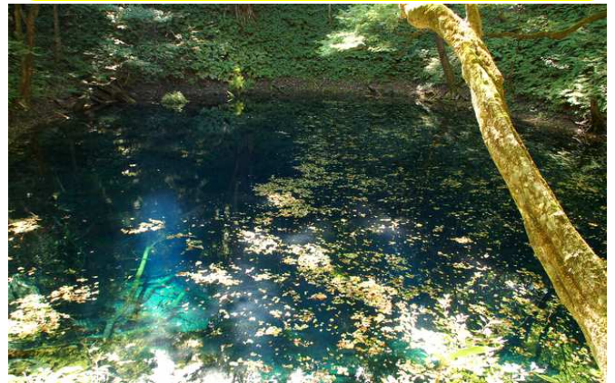
▲青い水を垂らしたような美しい群青色の水面をたたえる青池

白神山地はブナの原生林を中心に総面積約13万haもの広大なエリアにまたがる手付かずの自然の宝庫。特別天然記念物クマゲラやイヌワシなど貴重な動植物が生息する豊かな森は、世界的にも極めて高い自然価値を有するとして、1993年、日本で初めて世界自然遺産に登録されました。四季折々に美しい自然景観