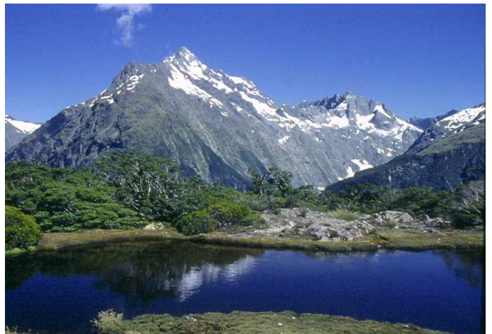
▲ルートバートラック1日目、360度の山岳大展望が広がるキーサミット