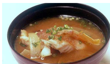
↑島の郷土料理も楽しみです。写真はアカバ(アカハタ)の味噌汁