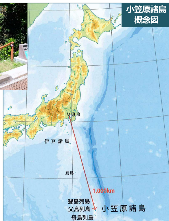
小笠原諸島 概念図