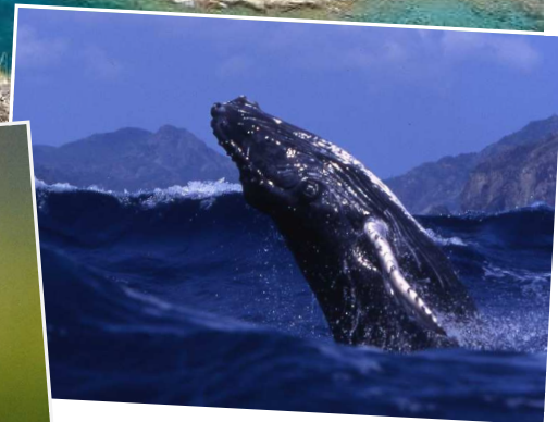
↑2月~4月下旬はザトウクジラが見られるベストシーズン(イメージ)