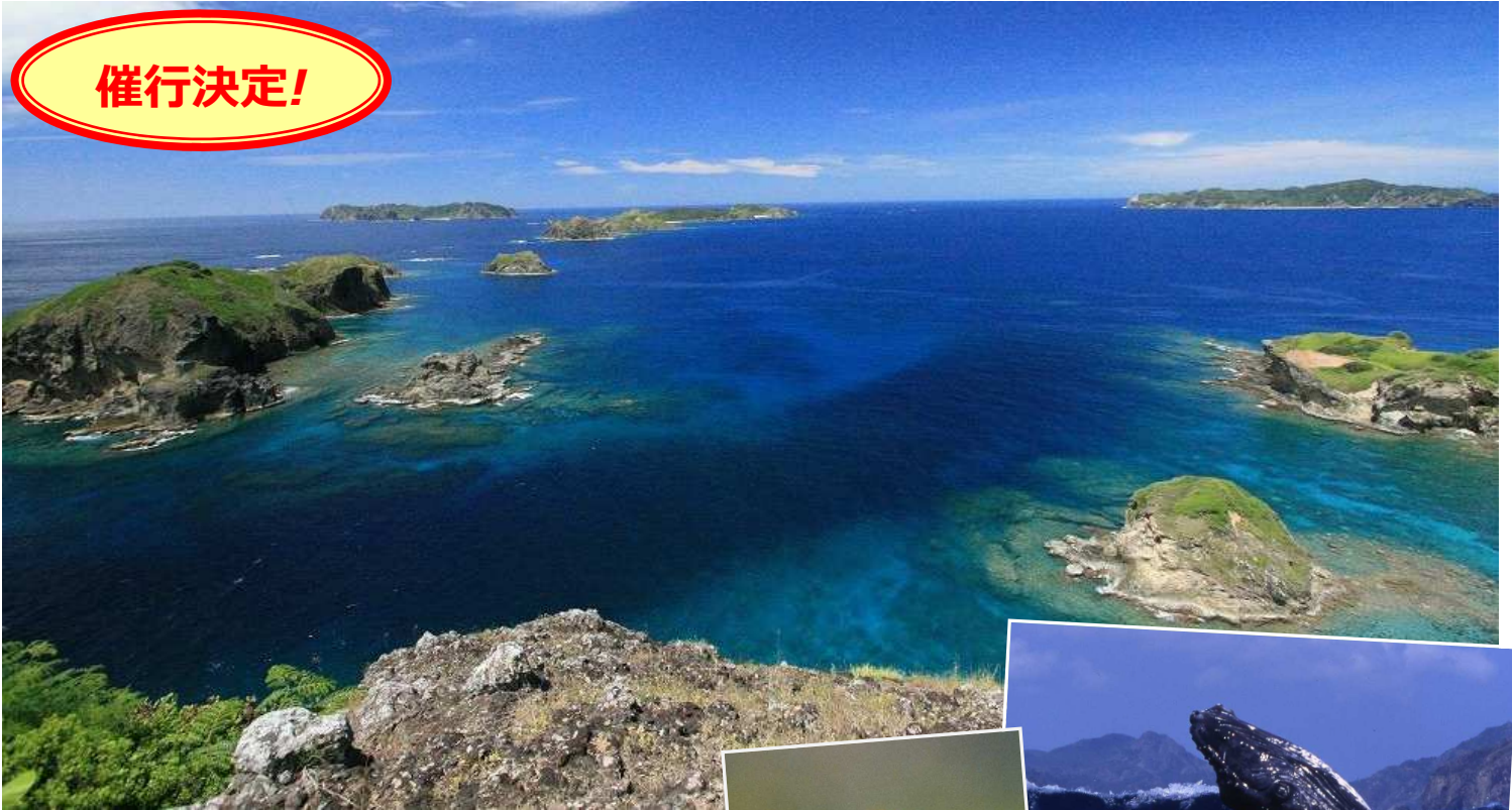
↑母島の南端、小富士から見渡す紺碧の大海原