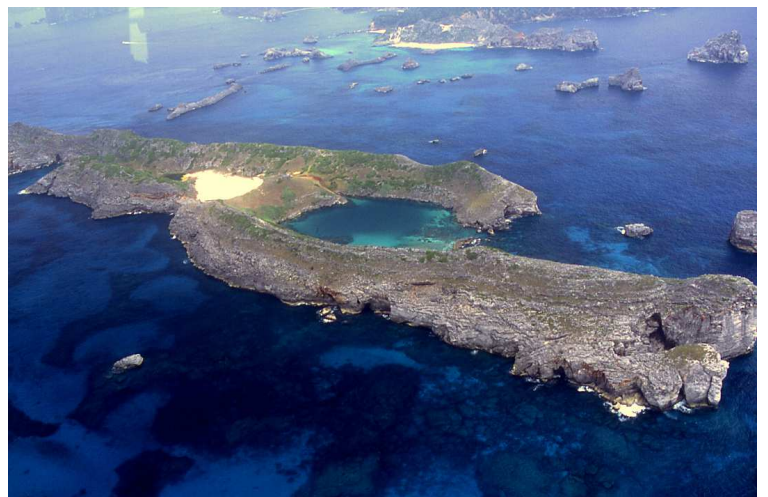
↑自然保護から上陸者数が制限されている無人島の南島。海ガメの産卵地としても知られています