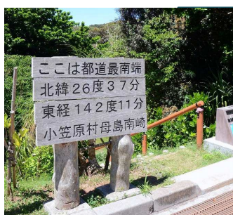
↑母島の「南崎」へのハイキングコースは都道最南端からスタート