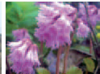
▲大佐渡山脈縦走路のオオイワカガミは花がたわわ ◀気持ちの良い平原が広がるイモリ平