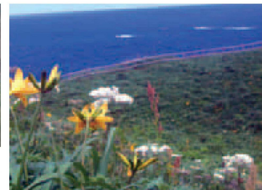
▲国の名勝指定地・尖閣湾 ▶青い海原にトビシマカンゾウの鮮やかな黄色が映える大野亀