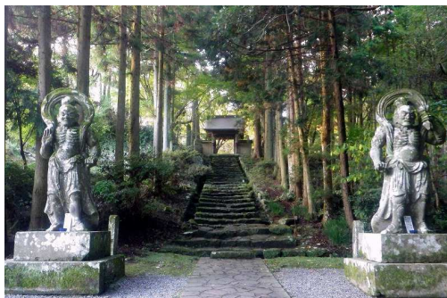
←六郷満山の総寺院・両子寺。国東半島の最高峰・両子山の麓にあり、苔むした石段と仁王像が建つ参道の景観が有名です(2日目)

【利用予定航空会社】 全日空、日本航空、エアドゥ、ソラシド エアーなど 【利用予定ホテル】 スパランド真玉山翠荘、国見温泉あかねの郷、梅園の里 または同等クラス 【食事】 朝3回・昼0回・夕3回 【最少催行人数】 4名 【一人部屋追加料金】 10,000円 【添乗員または登山ガイド】 新千歳空港から全行程同行 ※6名様以上で現地トレイルガイド同行