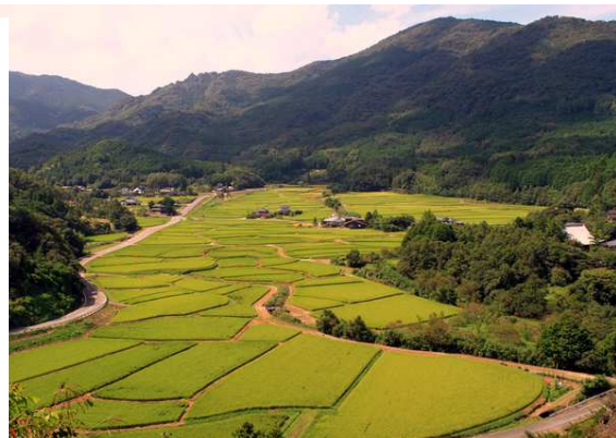
→宇佐神宮の荘園として栄えた田染荘。中世の農村景観を残す地として世界農業遺産に認定されています(1日目)