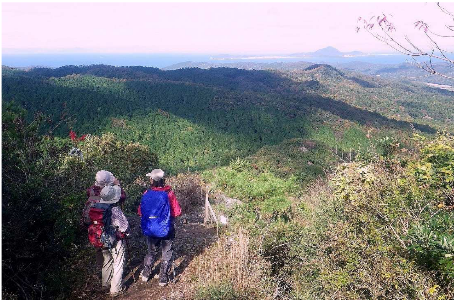
↑大海原を一望する明るい尾根道から鬱蒼とした森へ。のどかな山里や古刹、石仏などトレイルの風景は変化に富んでいます

旅行代金 168,000 円 (新千歳発着) 150,000 円 (羽田発着) 108,000 円 (大分発着)