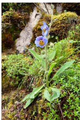
メコブシス・コルデラ