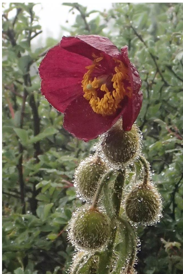
メコノプシス・ワリッキー