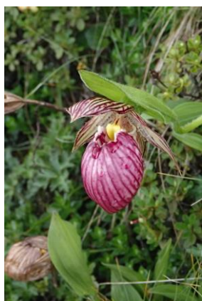
ヒマヤアツモリソウ

■ 歩行の行程は原則として上記を予定しておりますが、現地事情により変更する場合があります。