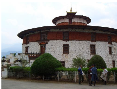
パロの望楼タ・ゾン (現在は博物館)