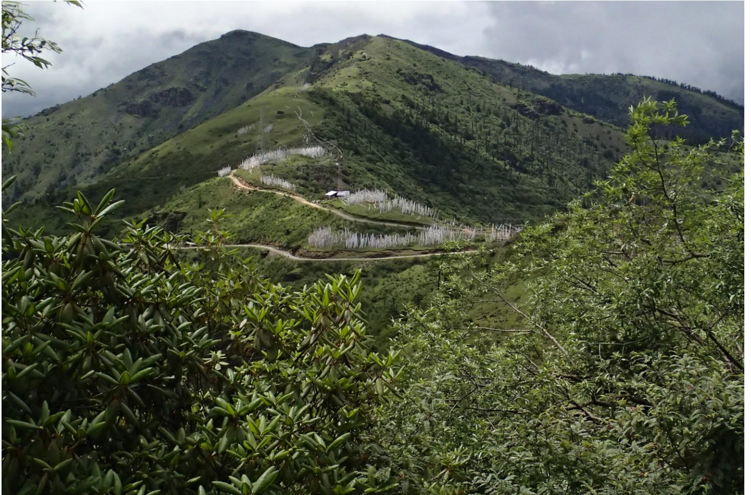
ヒマラヤの王国ブータンではちょっとした峠でも 3,500m を超えます (チェレ・ラ峠/3,750m)

2016年の今年、日本～ブータン国交30周年の記念すべき年です。国交樹立以来、政府、民間レベルで様々な交流を続けてきた日本とブータンの関係は、今や親友と言える間柄にまで発展しました。