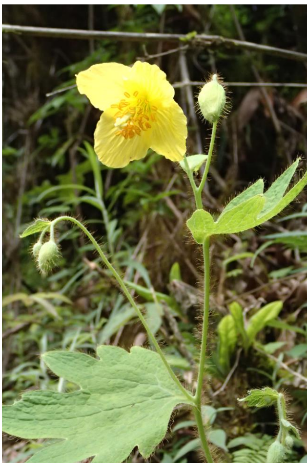
カトカルティア・ウィローサ