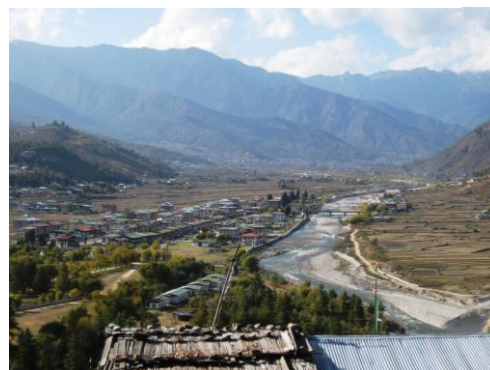
パロの谷を俯瞰する