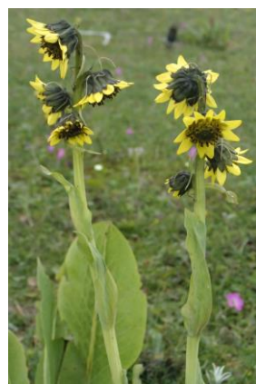
クレマントデューム