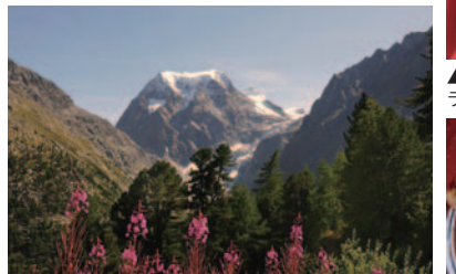
▲アローラから見上げる名峰モンコロ(3637m)