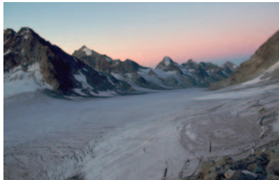
▲軽アイゼンを付けてシェイロン氷河を通過(6日目)

※トレッキングのコースは現地の状況により、一部変更となる場合があります。 ※軽アイゼン(6～8本爪)をご用意下さい。レンタルについてはお問い合わせ下さい。