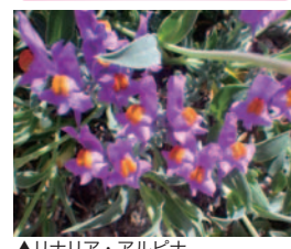
▲リナリア・アルピナ