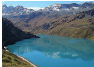
▲美しい湖水をたたえるモワリー湖(7日目)