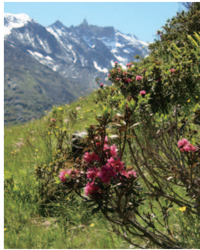
▲花と山岳絶景広がるトレイルを尾根、峠、谷を越えて歩きます(写真の花はアルペンローゼ)