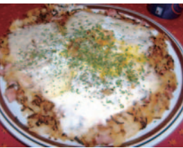
▲山小屋ではスイスの伝統料理「レシュティ」も味わえます(イメージ)