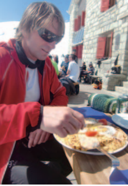
▲目前に名峰を仰ぐ山小屋のテラスでランチタイム(5日目のディス小屋)

オート・ルート(Haute Route) フランス語で“高い道”という意味で、シャモニ～ツェルマット間の約180kmをアルプスの山懐を縫うようにつけられた高所ルートのこと。冬の山岳スキールートとして知られていますが、花や氷河歩き、山上湖に映られる山並みなど夏の景観はまた別格です。当ツアーでは多彩なルートの中から、技術的に特に難しい箇所も無く、素晴らしいアルプスの山岳展望と多彩な高山植物が見られる人気のコースへご案内します。