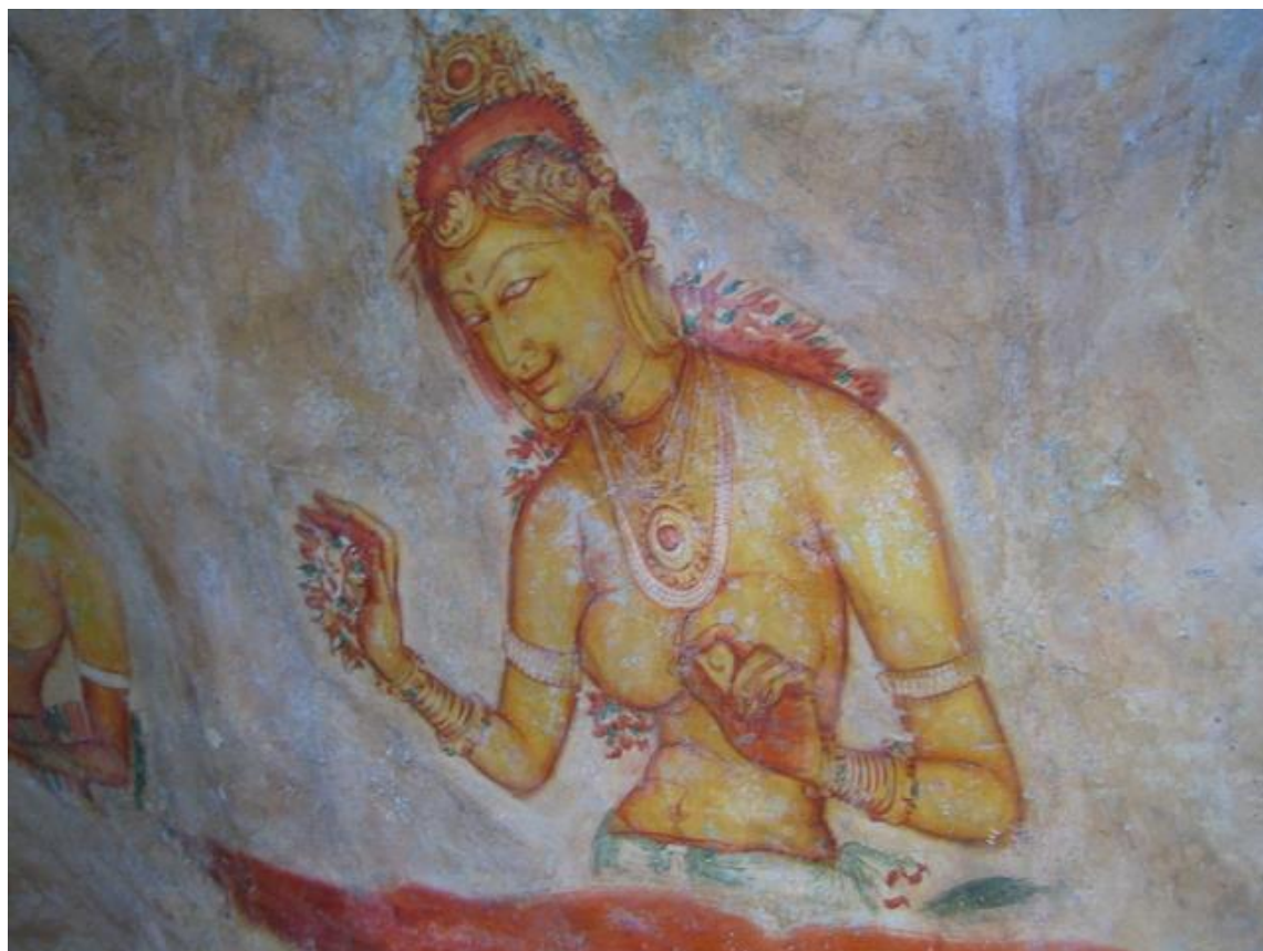
シギリャロック (イヌヅ)