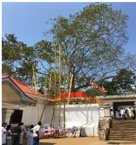
スリーマハー菩提樹