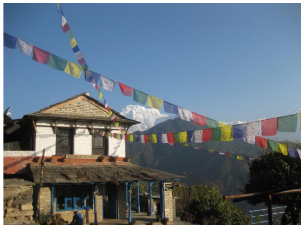
祈りのルンタが風になびくダンプス村

※観光地訪問の順序は現地事情によって入れ替わる場合があります。あらかじめご了承ください。