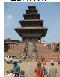
カトマンズ旧王宮