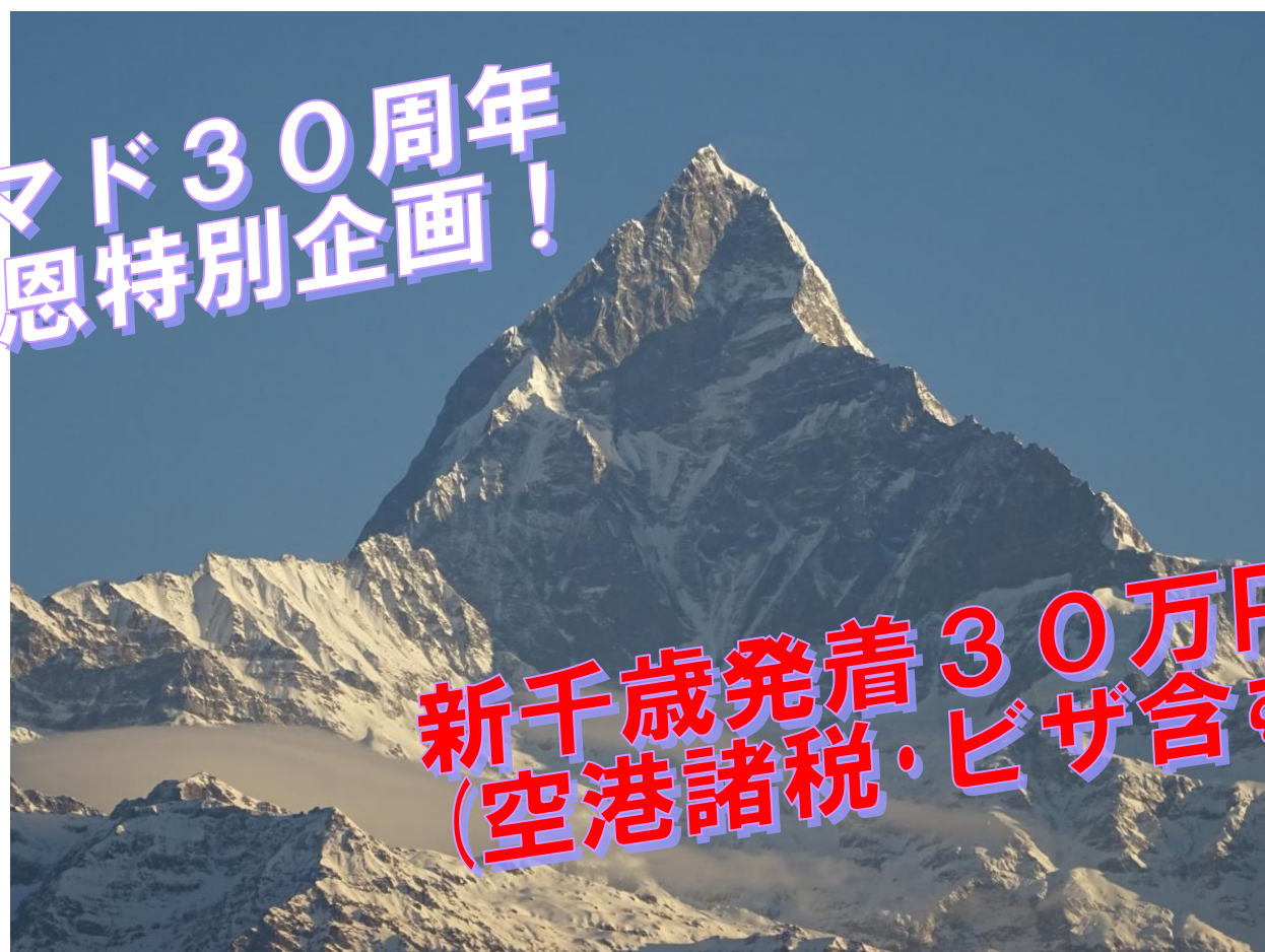
ポカラより望む聖峰マチャブチャレ(6993m)