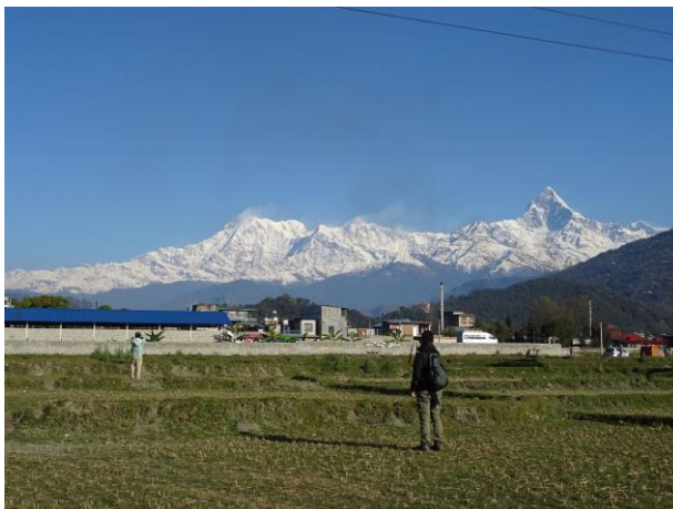
ポカラ郊外からマチャブチャレやアンナプルナを見る