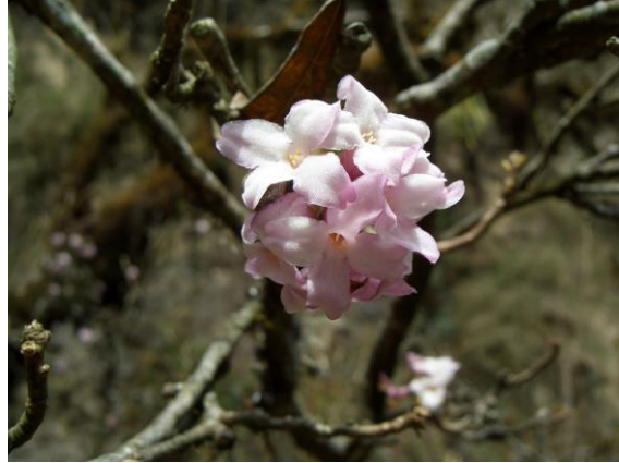
沈丁花(じんちょうげ)も開花の季節