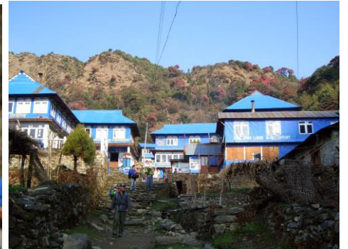
ゴラパニのロッジ群