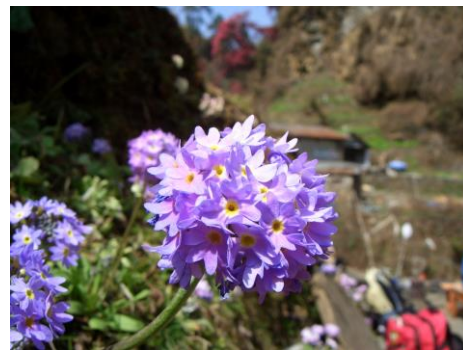
大きなサクラソウ