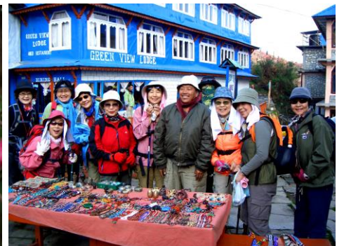
露店で値段交渉成立!