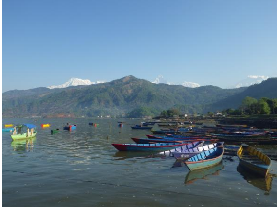
ポカラのペワ湖とアンナプルナ連峰