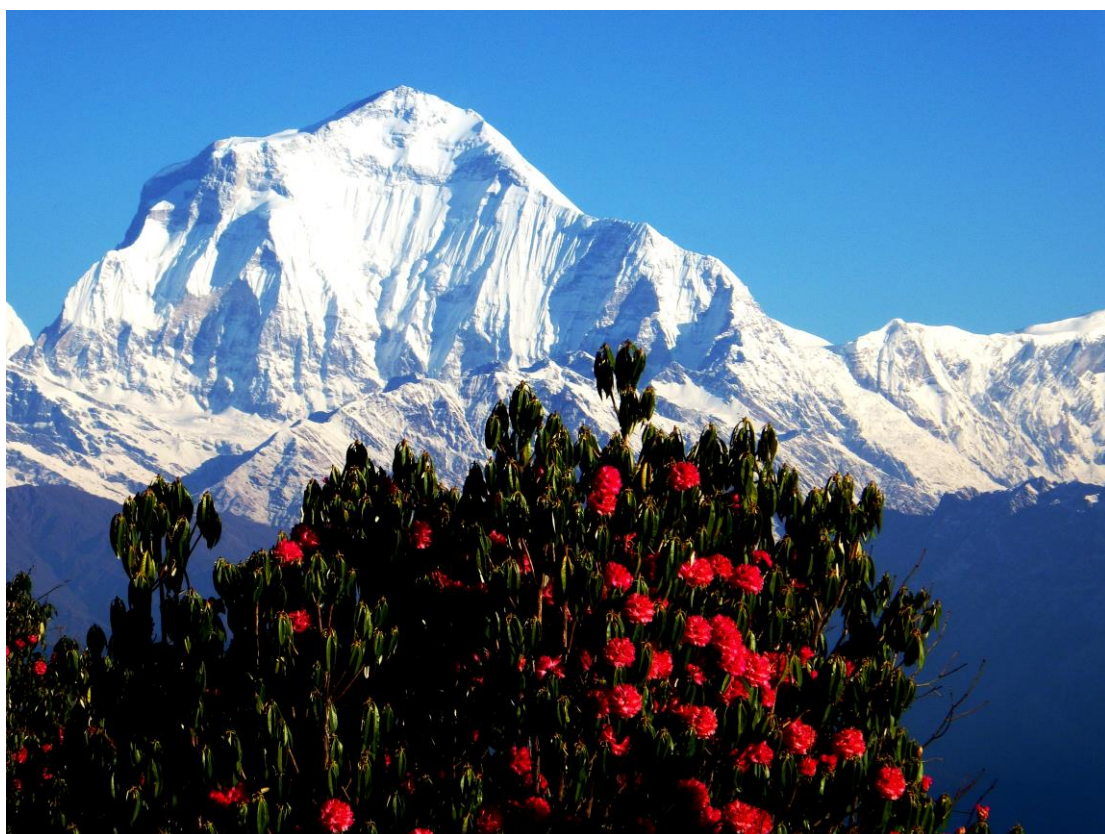
しゃくなげとダウラギリ I 峰