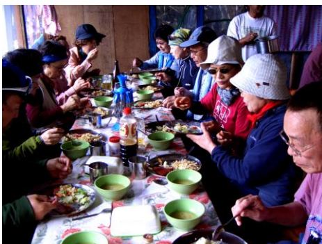
食事風景(デオラリ)