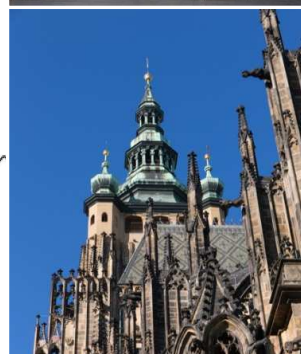
プラハ歴史地区はまさに建築様式の博物館。プラハ城（上）と聖ヴィート聖堂（下）