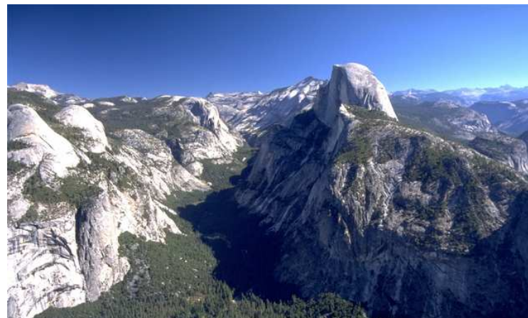
▲トレッキング終了後はヨセミテ国立公園を観光。写真はグレイシャーポイントから見たハーフドーム (イメージ)