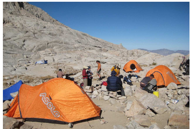
▲キャンプ地の様子 (イメージ)