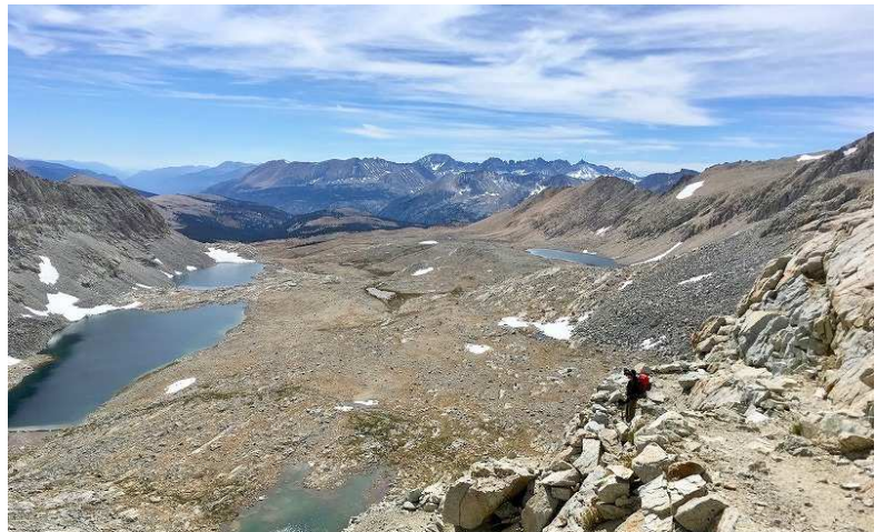
▲いくつも越える峠からはシエラネバダの山並みや湖群、大草原、湿原、溪流など、雄大な展望が広がり感動の連続です