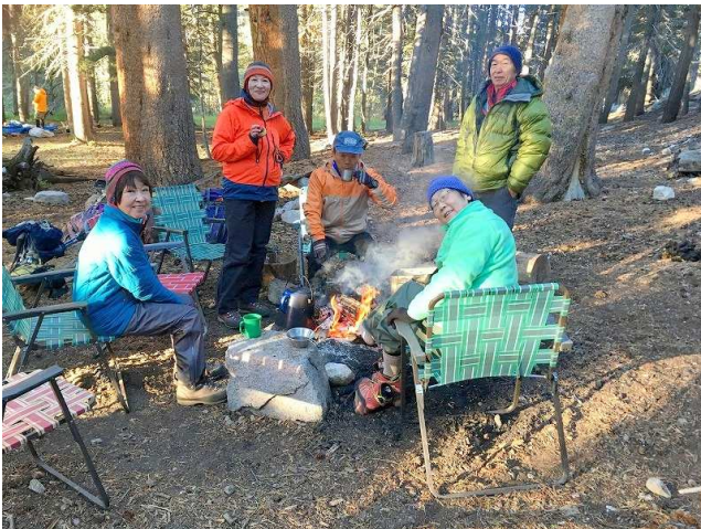
▲大自然に抱かれて食すキャンプ地での料理は格別