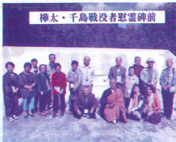
樺太・千島戦没者慰霊碑前