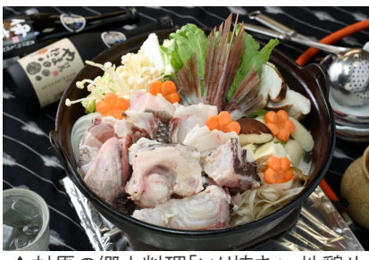
▲対馬の郷土料理「いり焼き」。地鶏や新鮮な魚介類、山の幸を盛り込んだ鍋