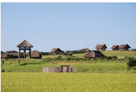
▲弥生時代の集落跡を復元した原の辻遺跡。「魏志和入伝」に書かれた一支国の都跡といわれています

※現地の諸事情や天候などにより、観光場所やルートが変更したり入れ替わったりする場合があります。あらかじめご了承ください。 ※歩程は休憩などを除いた実質歩行時間の目安です。 ※昼食は各自でお願いいたします(食事処へはご案内します)