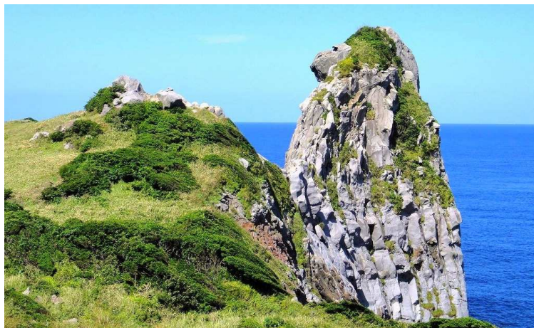
▲壱岐のシンボル猿岩。高さ45mほどの猿に似た大岩が、顔を海の方へそっぽを向けている姿が何ともユーモラス

九州最北端、本土から132km離れた玄界灘に浮かぶ対馬。韓国までの距離はわずか49.5kmで、古来より対朝鮮の国防の要として重要な役割を担ってきました。その歴史が刻まれた史跡旧跡が島内には随所に点在し、日本文化のルーツを垣間見ることができます。また島土の89%を山地が占め、霊峰として崇められた白嶽を始め、山間部には大陸系の植物と日本系の植物が混生する珍しい自然体系が息づいています。一方の壱岐は「魏志倭人伝」にも“一支国(いっきこく)”として名が登場する歴史深い島。名所旧跡を訪ねて遙か古代に海の王都として栄えた息吹に触れます。また、玄界灘の荒波が造り出した絶景の海岸美も探勝。2島の自然と歴史をたっぷり満喫する6日間です。